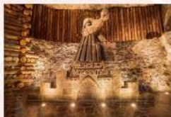
เหมืองเกลือวิลิซก้า