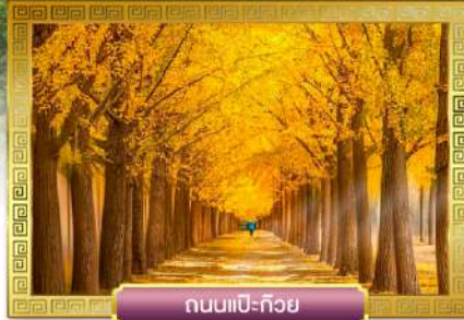
ถนนแปะก๊วย