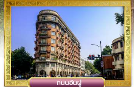
ถนนอันฟู