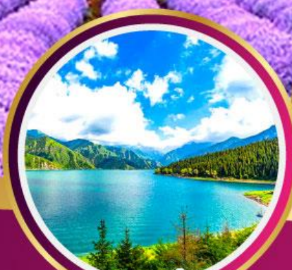
ทะเลสาบเทียนชาน