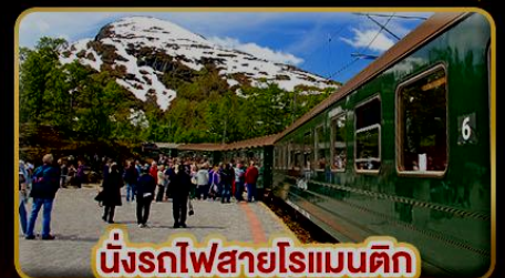
นั่งรถไฟสายโรแมนติก “พร้อมสปา”