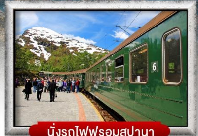
นั่งรถไฟพร้อมสปา

พิเศษ! พักบนเรือสำราญ แบบ Window Room 2 คืน, พักบ้านแซนต้าคลอส