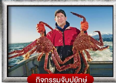
กิจกรรมจับปูยักษ์