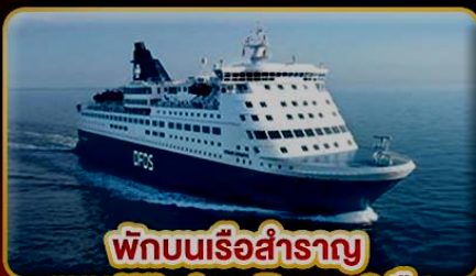
พักบนเรือสำราญ แบบ Window Room 2 คืน