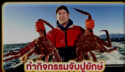
ทำกิจกรรมจับปูยักษ์ “พร้อมเมนูสุดพิเศษ”