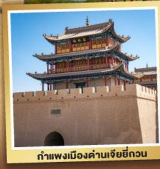
กำแพงเมืองด่านเจียหยี่กวน