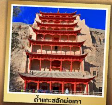
ต้าเถะสลักม่อเกา