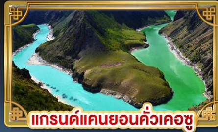
แกรนด์แคนยอนคั่วเคอซู