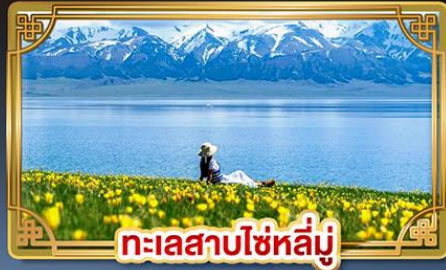
ทะเลสาบไซหลี่มู่