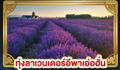
ทุ่งลาเวนเดอร์อูฟาอ้อฮั่น