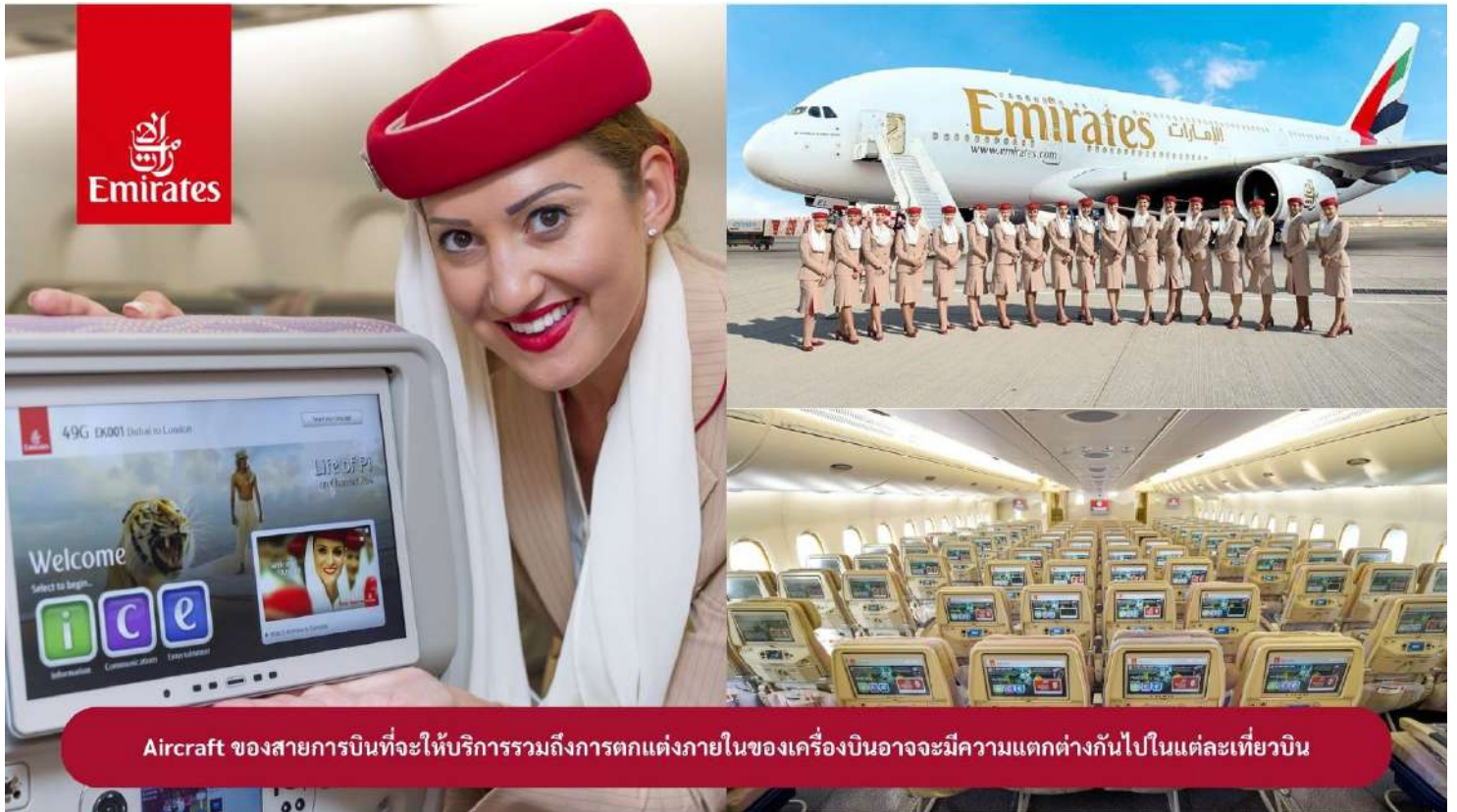
Aircraft ของสายการบินที่จะให้บริการรวมถึงการตกแต่งภายในของเครื่องบินอาจจะมีความแตกต่างกันไปในแต่ละเที่ยวบิน

23.00 น. 🛫 ขณะเดินทางพร้อมกัน ณ สนามบินสุวรรณภูมิ อาคารผู้โดยสารขาออกระหว่างประเทศ ชั้น 4 ประตู 9 แถว T สายการบินเอมิเรตส์ แอร์ไลน์ (EK) เจ้าหน้าที่ให้การต้อนรับและอำนวยความสะดวก