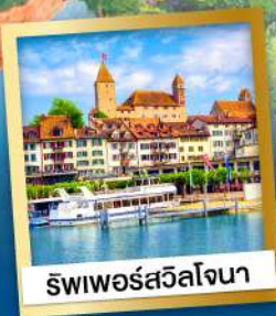
ริวีเอราดีซาลโซกรานด์