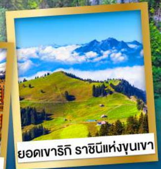
ยอดเขาธิกี ราชนิแห่งขุนเขา