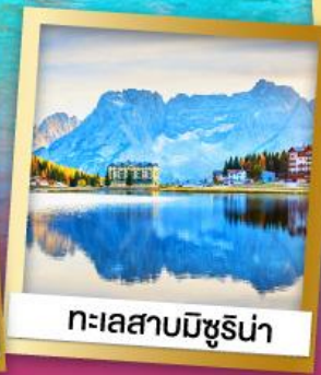
ทะเลสาบมิชูริน่า