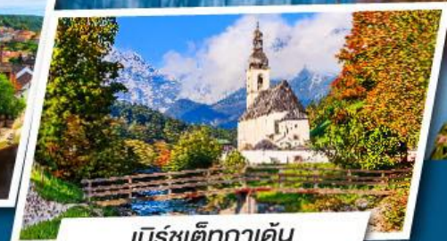
เบิร์ชเต็กกาเดิน