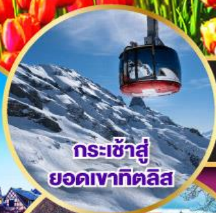
กระเช้าสู่ ยอดเขาทิตลิส

19-28 มี.ค.68 / 01-10, 12-21, 14-23 เม.ย.68 03-12, 04-13, 05-14 พ.ค.68