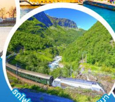
รถไฟสายโรแมนติกฟลัมส์บานา