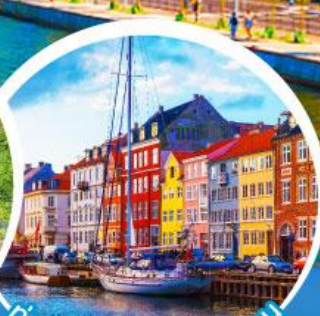
ท่าเรือฮาวน์.โคเปนเฮเกน