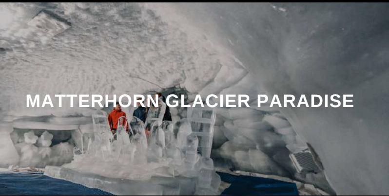
MATTERHORN GLACIER PARADISE