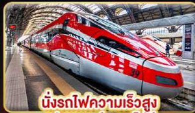
นั่งรถไฟความเร็วสูง ฟลอเรนซ์ - นาโปลี