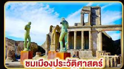
ชมเมืองประวัติศาสตร์ ปอมเปอี