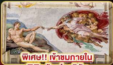
พิเศษ!! เข้าชมภายใน พิพิธภัณฑ์วาติกัน