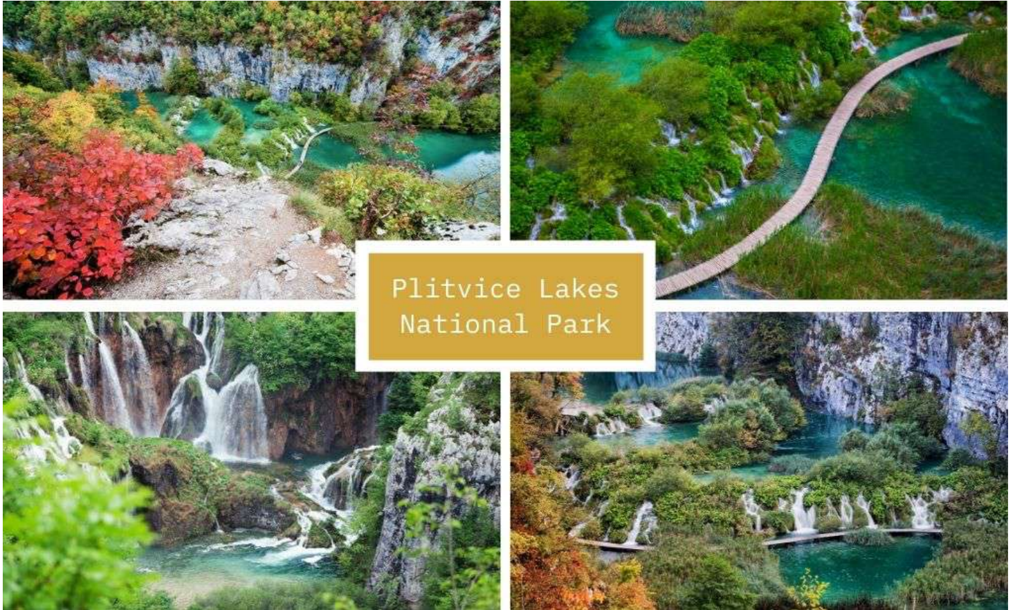
Plitvice Lakes National Park