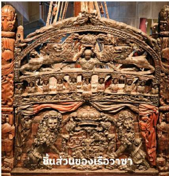
ชิ้นส่วนของเรือวาซา