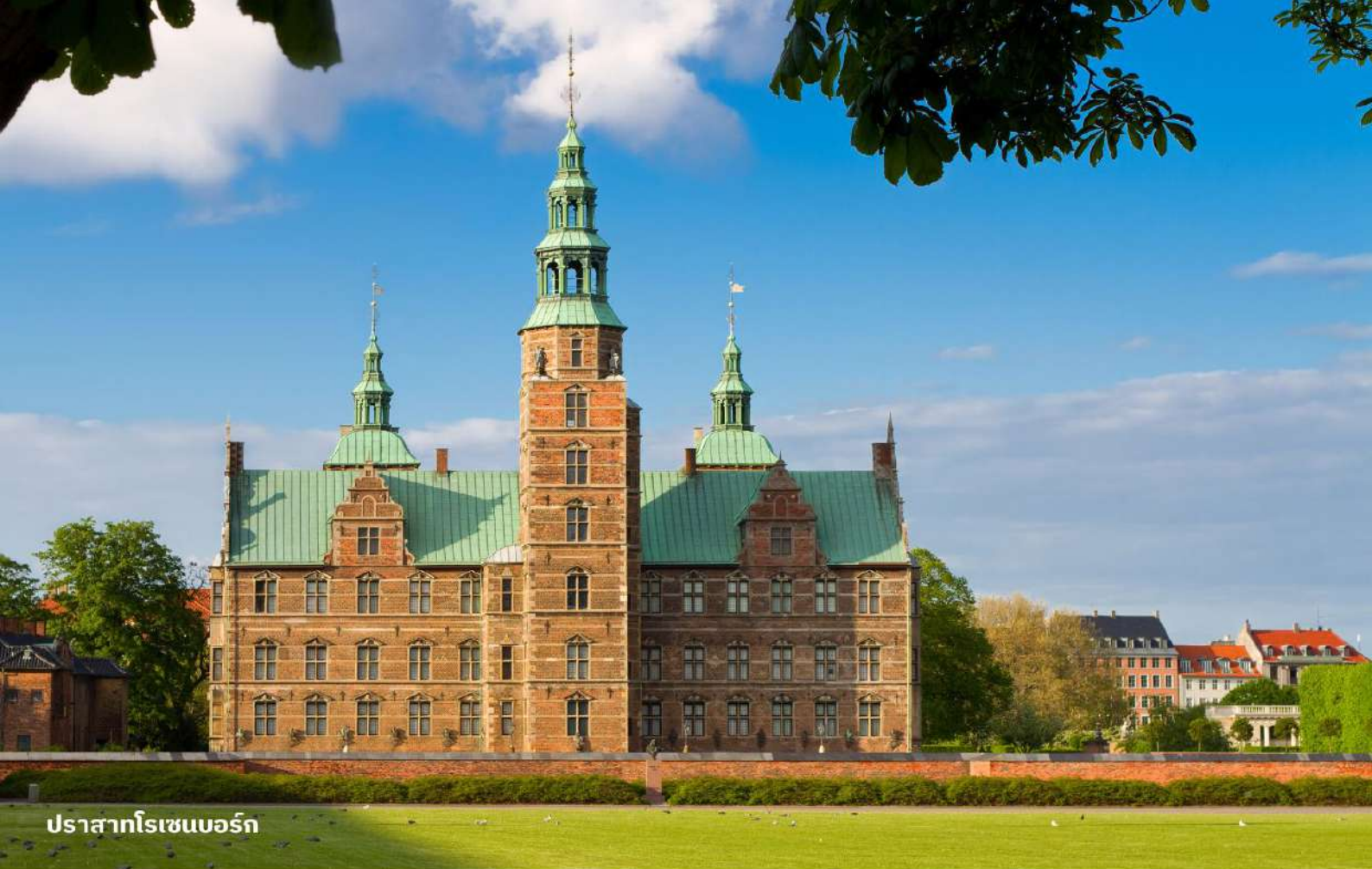
ปราสาทโรเซนบอร์ก