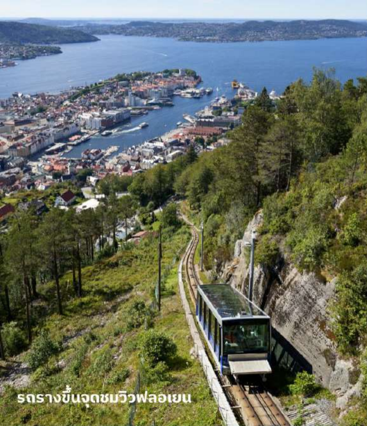
รถรางขึ้นจุดชมวิวฟลอยเอน

หลังจากนั้นนำท่านเดินทางสู่ ยอดเขาฟลอยเอน (Floyen) โดยรถรางไฟฟ้า ผ่านแมกไม้ทิวทัศน์สวยๆ งามๆ ตลอดทาง แม้จะเป็นฤดูหนาวแต่สำหรับเบอร์เก้นแล้วนี่คือเมืองที่มีอากาศไม่หนาวจัดเท่าเมืองอื่นๆ ของนอร์เวย์จากการที่มีแนวเทือกเขาล้อมกันกระแสน้ำอุ่น ในขณะที่มีกระแสน้ำอุ่นเชื่อมต่อกับทะเลเข้าสู่เมือง ชมวิวกันเพลินๆ ก่อนที่รถรางจะเข้าจอดที่สถานีบนยอดเขาในระดับความสูงเหนือระดับน้ำทะเล 320 เมตร ทำให้มองเห็นไกลไปถึงท่าเรือใหญ่ที่มีทั้งเรือรบและเรือสำราญหรือเห็นบ้านเรือนและผู้คน เห็นถึงความ เป็นเมืองท่องเที่ยวที่มีครบทุกรูปแบบจากวิวพาโนรามาที่ทำให้มองเห็นภาพความเป็นเบอร์เก้นได้ชัดเจนที่สุด