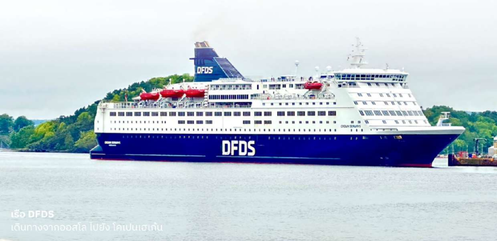
เรือ DFDS เดินทางจากออสโล ไปยัง โคเปนเฮเก้น