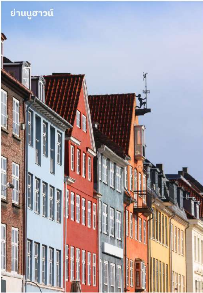
ย่านนูฮาวน์