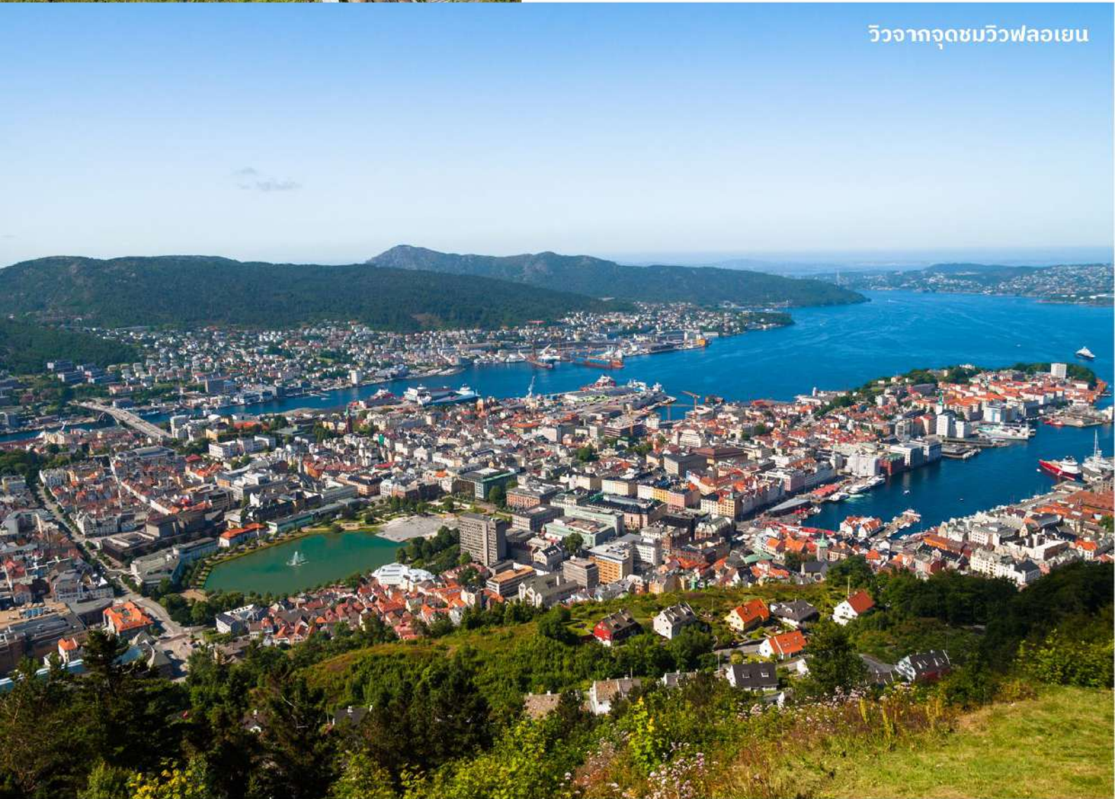
วิวจากจุดชมวิวฟลอยเอน

หลังจากนั้นนำท่านเดินทางสู่ ยอดเขาฟลอยเอน (Floyen) โดยรถรางไฟฟ้า ผ่านแมกไม้ทิวทัศน์สวยๆ งามๆ ตลอดทาง แม้จะเป็นฤดูหนาวแต่สำหรับเบอร์เก้นแล้วนี่คือเมืองที่มีอากาศไม่หนาวจัดเท่าเมืองอื่นๆ ของนอร์เวย์จากการที่มีแนวเทือกเขาล้อมกันกระแสน้ำอุ่น ในขณะที่มีกระแสน้ำอุ่นเชื่อมต่อกับทะเลเข้าสู่เมือง ชมวิวกันเพลินๆ ก่อนที่รถรางจะเข้าจอดที่สถานีบนยอดเขาในระดับความสูงเหนือระดับน้ำทะเล 320 เมตร ทำให้มองเห็นไกลไปถึงท่าเรือใหญ่ที่มีทั้งเรือรบและเรือสำราญหรือเห็นบ้านเรือนและผู้คน เห็นถึงความ เป็นเมืองท่องเที่ยวที่มีครบทุกรูปแบบจากวิวพาโนรามาที่ทำให้มองเห็นภาพความเป็นเบอร์เก้นได้ชัดเจนที่สุด