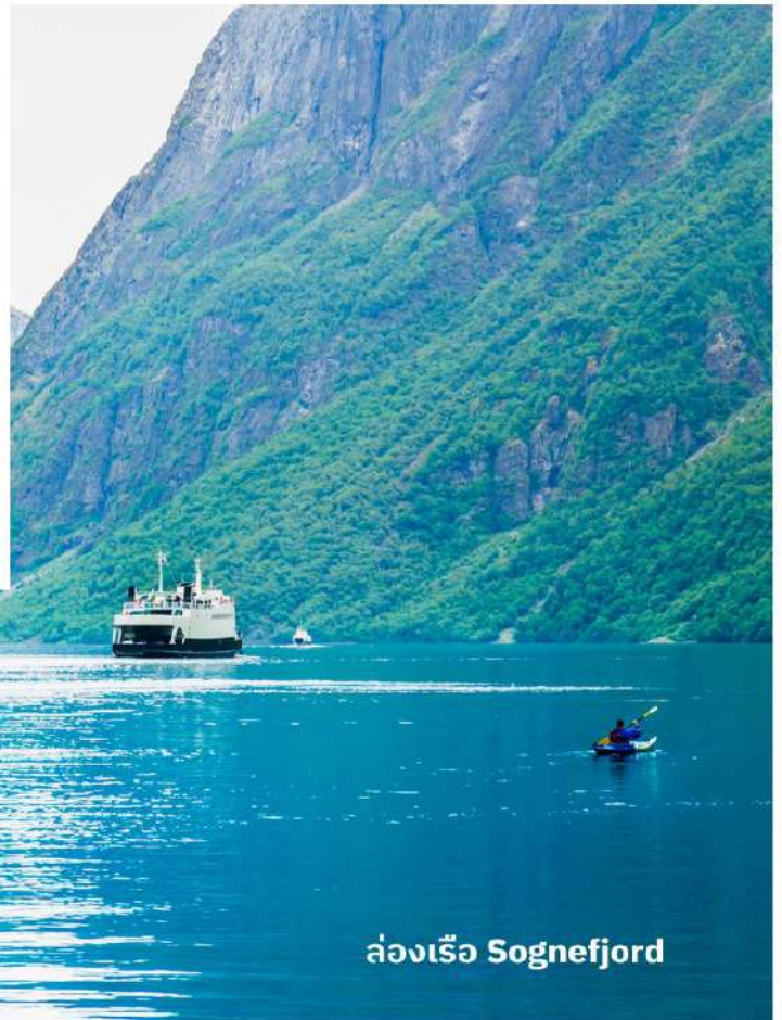
ล่องเรือ Sognefjord