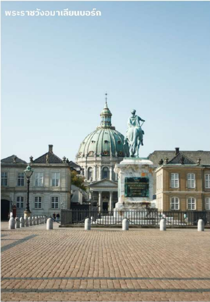
พระราชวังอมาเลียนบอร์ก