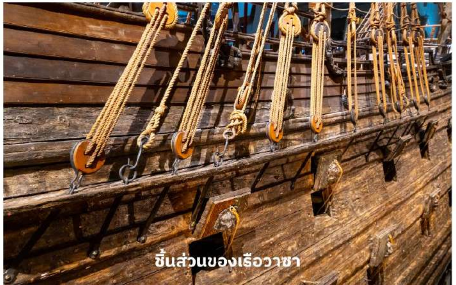
ชิ้นส่วนของเรือวาซา