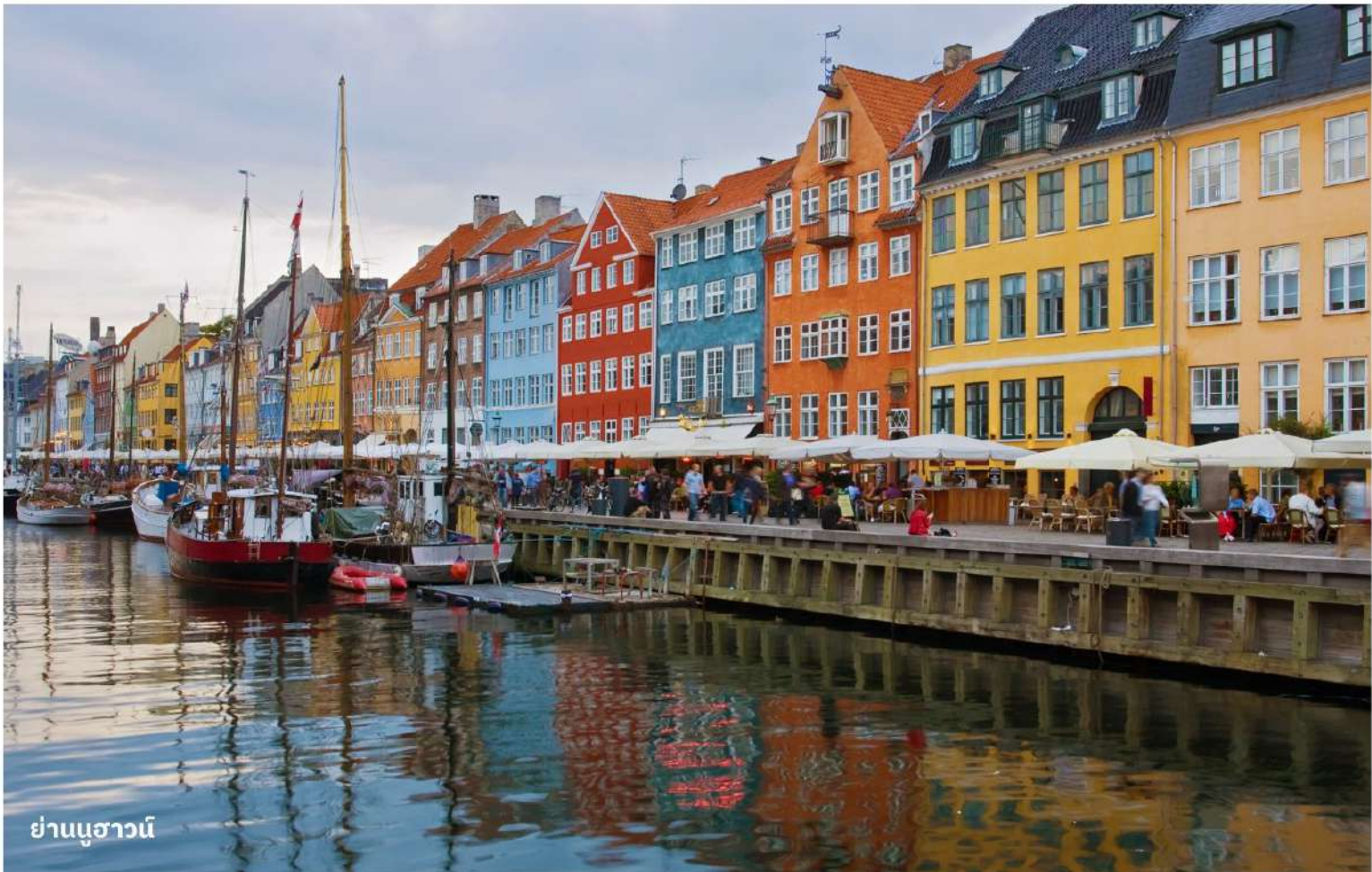
ย่านนูฮาวน์

ในช่วงฤดูร้อนนูฮาวน์เป็นที่นิยมสำหรับวัยรุ่นชาวเดนมาร์ก ที่นิยมมานั่งรับประทานอาหารและเครื่องดื่ม อีสาระให้ท่านเดินเล่นถ่ายรูปเก็บความทรงจำตามอัธยาศัย ได้เวลาอันสมควรนำท่านสู่สนามบิน