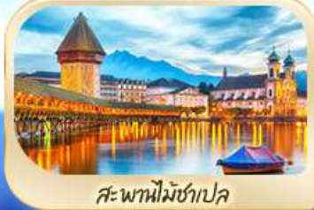
สะพานไมซ์าเปิล