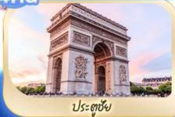
ประตูชัย