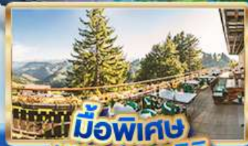
มือพิเศษ บนยอดเอาริก