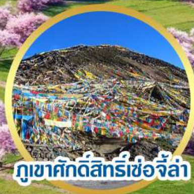
ภูเขาศักดิ์สิทธิ์ชื่อจีล่า