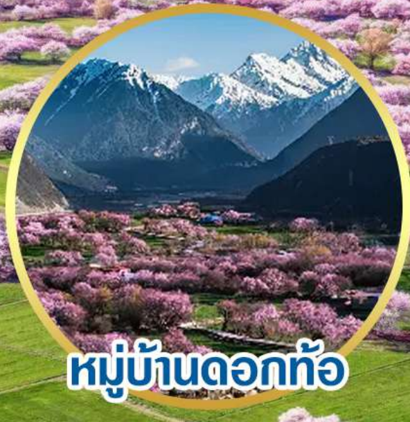
หมู่บ้านดอกท้อ