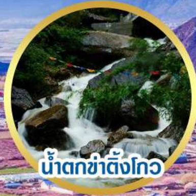
น้ำตกชาติังโก