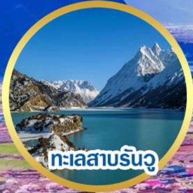
ทะเลสาบรินจู่