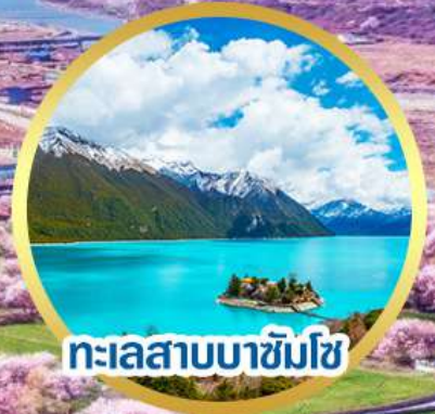
ทะเลสาบบาซังโซ