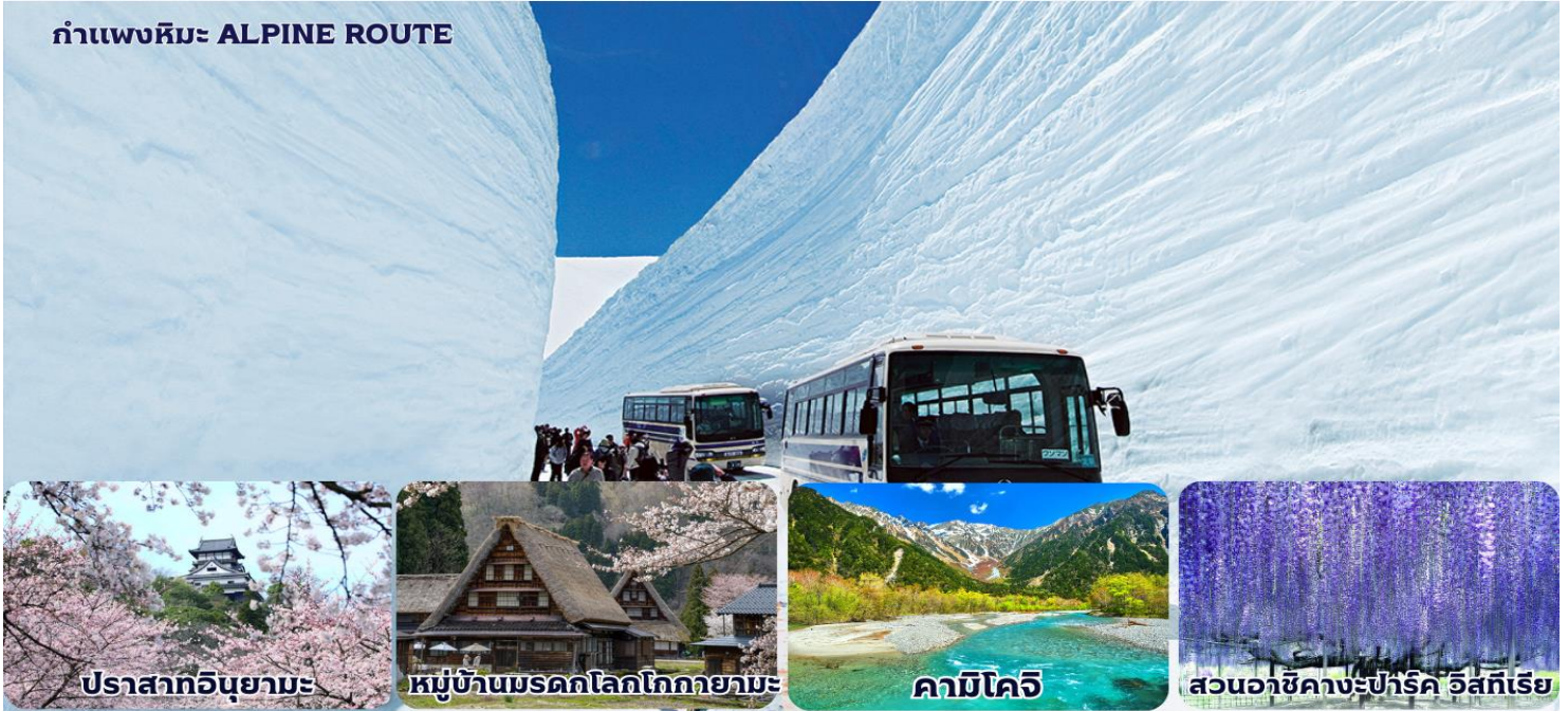
ปราสาทอุซุมามะ