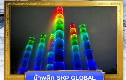
น้ำพุตึก SKP GLOBAL