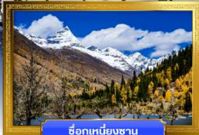
ชื่อภูเขาหนึยงชาน