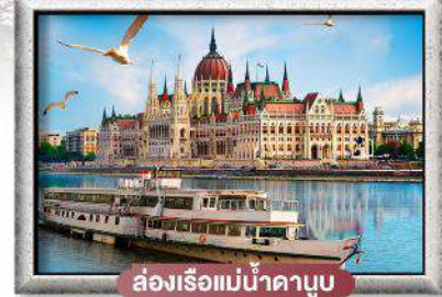
ล่องเรือแม่น้ำดานูบ

พิเศษ!! ลิ้มลองเมนูประจำชาติ ทั้ง 5 ประเทศ!!!