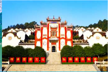
บ้านเกิดกวี ขวี่หยวน