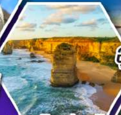
เกรทโอเชียนโรด