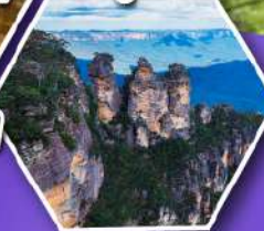
อุทยานบลูเมาส์แท่น