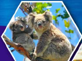
ชมหมีโคอาล่า ณ สวนสัตว์ซิดนีย์