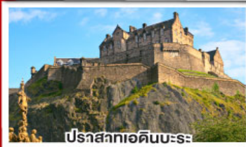
ปราสาทเอดิเนบะระ

เยือนสโตนเฮนจ์ และ พิพิธภัณฑน์โรมันโบราณ