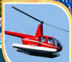
ขึ้นเฮลิคอปเตอร์ ชมวิวก 360 องศา