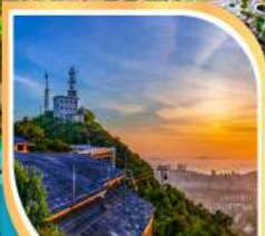
ชมวิวก ยอดเขาเฟิงหวง