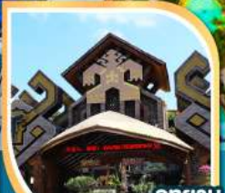
อุทยาน วัฒนธรรมผ้าแม้ว-หลี่ กิจกรรมรอบกองไฟ