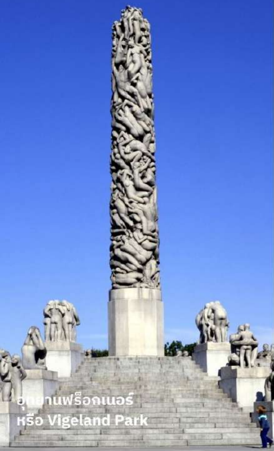
อุทยานฟรีกเนอร์ หรือ Vigeland Park

เป็นสวนสาธารณะที่มีชื่อเสียงในเมืองออสโล เป็นสวนที่จัดแสดงงานประติมากรรมของศิลปินชื่อดังชาวนอร์เวย์ชื่อ Gustav Vigeland ซึ่งประกอบไปด้วยงานประติมากรรมมากกว่า 200 ชิ้น ซึ่งเน้นที่ศิลปะที่เป็นธรรมชาติและมนุษย์ทำให้ Frogner Park เป็นสถานที่ท่องเที่ยวที่น่าสนใจอย่างมากในออสโล