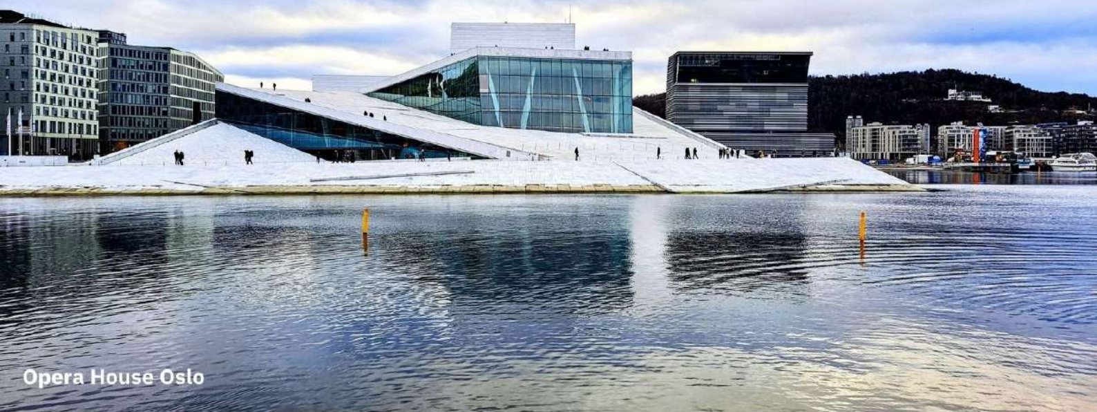
Opera House Oslo

จากนั้นนำท่านถ่ายรูป The Oslo Opera House หนึ่งในโครงการปรับปรุงบริเวณชายฝั่งของออสโล ให้เกิดเป็นพื้นที่ที่มีประโยชน์ ด้วยเงินทุนมหาศาล และการปรับผังการจราจรของชายฝั่งด้านตัวเมือง ออสโล ภายในอาคารมีการจัดแสดงการแสดงโอเปร่าและบัลเลต์ รวมถึงการแสดงศิลปะอื่น ๆ อีกมากมาย มีห้องแสดงหลักที่สามารถรองรับผู้ชมได้มากกว่า 1,300 คน Oslo Opera House เป็นหนึ่งในสถาปัตยกรรมที่โดดเด่นและเป็นที่รู้จักมากที่สุดของประเทศ และได้รับรางวัลหลายรางวัลสำหรับการออกแบบที่สร้างสรรค์และนวัตกรรม