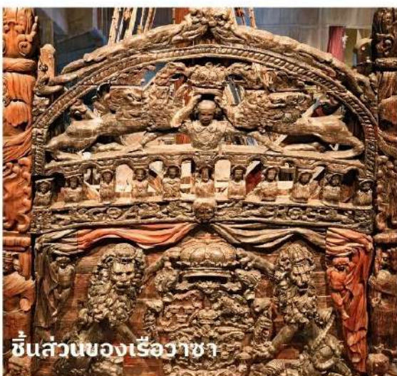
ชิ้นส่วนของเรือวาซา