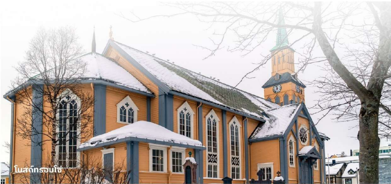
โบสถ์ทรอมโซ่

เป็นโบสถ์ที่ตั้งอยู่ใจกลางเมืองทรอมโซ่ มีสถาปัตยกรรมสวยงาม และเป็นโบสถ์ไม้ที่ใหญ่ที่สุดในนอร์เวย์ สถานที่นี้ไม่เพียงแต่เป็นที่สักการะ แต่ยังเป็นจุดท่องเที่ยวที่มีความสำคัญทางวัฒนธรรมอีกด้วย