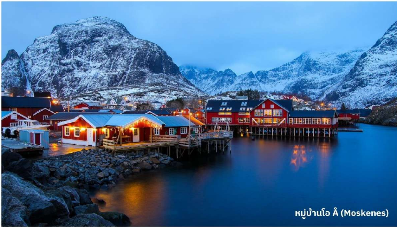
หมู่บ้านโอ Å (Moskenes)

จากนั้นนำท่านสู่ หมู่บ้านไรเนอ (Reine) ใช้เวลาเดินทางประมาณ 15 นาที หมู่บ้านเล็กๆ ที่ตั้งอยู่ในหมู่เกาะ Lofoten ของนอร์เวย์ ถือเป็นหนึ่งในสถานที่ที่สวยงามที่สุดในประเทศ มีทิวทัศน์ที่น่าทึ่งประกอบด้วยภูเขาสูงและฟยอร์ดลึก โดย Reine เป็นที่รู้จักในฐานะจุดหมายปลายทาง ยอดนิยมสำหรับนักท่องเที่ยวที่มองหาธรรมชาติที่งดงามและกิจกรรมกลางแจ้ง ให้ท่านได้เดินชม บรรยากาศที่สวยงามของเมือง และ ถ่ายรูปตามอัธยาศัย