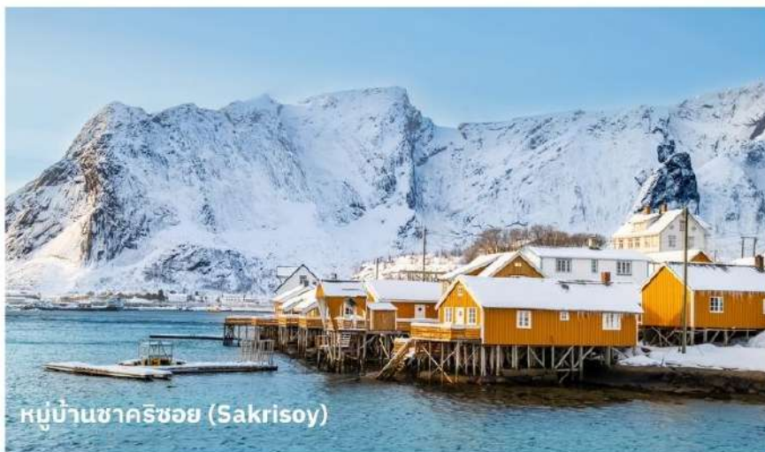
หมู่บ้านซาคริชอย (Sakrisoy)

จากนั้นนำท่านเดินทางต่อไปยัง หมู่บ้านซาคริชอย (Sakrisoy) ใช้เวลาเดินทางประมาณ 15 นาที