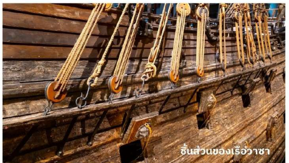
ชิ้นส่วนของเรือวาซา