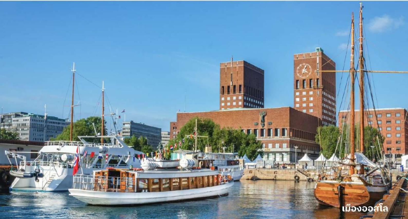
เมืองออสโล

เป็นเมืองที่มีค่าครองชีพสูงที่สุดในโลกแทนที่โตเกียว ออสโลตั้งอยู่ขอบด้านเหนือของอ่าวฟยอร์ด