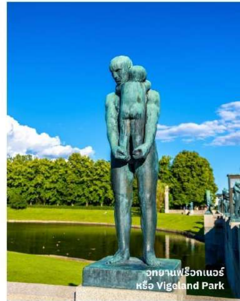
อุทยานฟรีกเนอร์ หรือ Vigeland Park

จากนั้นนำท่านถ่ายรูปด้านนอก ปราสาท Akershus งานสถาปัตยกรรมอันเก่าแก่ในยุคเรอเนสซองค์ และนำท่านเที่ยวชม กรุงออสโล นครเก่าแก่อายุกว่า 1,000 ปี เป็นเมืองหลวงมาตั้งแต่สมัยไวกิงเรื่องอำนาจ ผ่านชมทำเนียบรัฐบาล พระบรมมหาราชวังที่ประทับของพระมหากษัตริย์แห่งนอร์เวย์