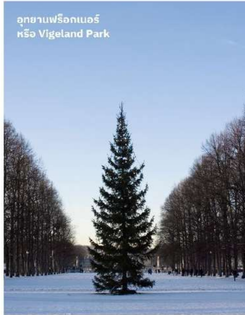
อุทยานฟรีกเนอร์ หรือ Vigeland Park