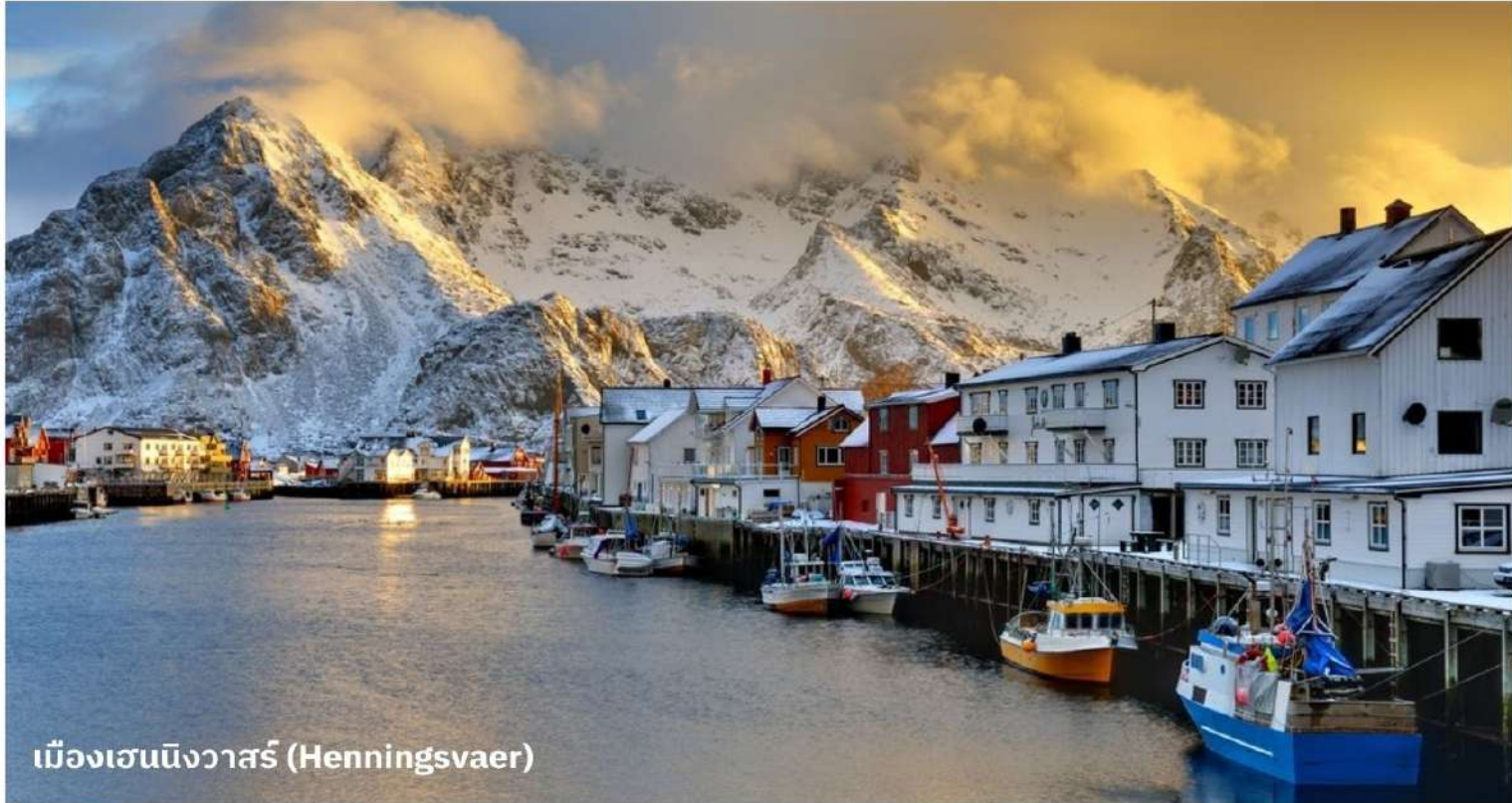
เมืองเฮนนิ่งวาร์ (Henningsvaer)

จากนั้นนำท่านเดินทางสู่ เมืองเฮนนิ่งวาร์ (Henningsvaer) เป็นเมืองท่าและหมู่บ้านชาวประมงเป็นที่รู้จักในเรื่องของสถาปัตยกรรมบ้านไม้สีสดใสที่ตั้งอยู่ริมทะเล อีกทั้งยังมีประวัติศาสตร์เกี่ยวกับการประมงที่ยาวนาน ในฤดูหนาว นักท่องเที่ยวสามารถชมปรากฏการณ์แสงเหนือ (Northern Lights) และในฤดูร้อนสามารถเพลิดเพลินกับกลางคืนที่ยาวนานของแสงแดด (Midnight Sun)