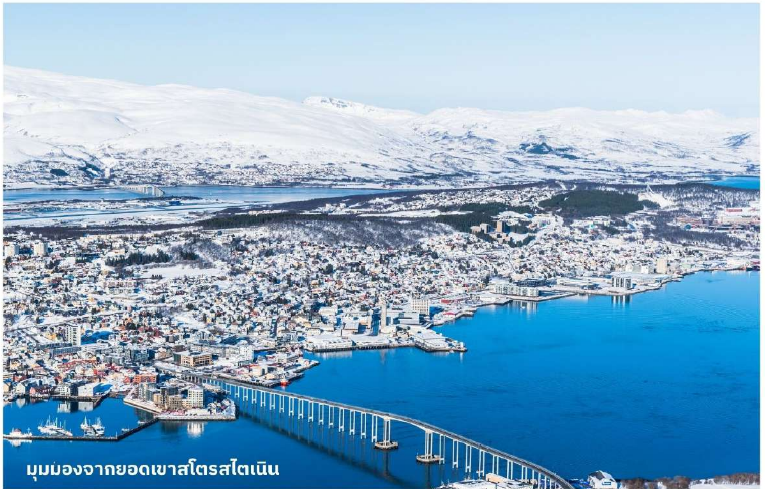
มุมมองจากยอดเขาสโตรสไตเนิน

จากนั้นนำท่าน สู่ยอดเขาสโตรสไตเนิน (STORSTEINEN MOUNTAIN) โดยกระเช้าไฟฟ้า เขาแห่งนี้เป็นหนึ่งในยอดเขาที่มีจุดชมวิวที่สวยงาม และเป็นที่ยอดนิยมในหมู่นักเดินทางและนักปีนเขา มีเส้นทางเดินป่าที่ท้าทายและทิวทัศน์ที่งดงาม เหมาะสำหรับผู้ที่ชื่นชอบธรรมชาติและกิจกรรมกลางแจ้ง อากาศให้ท่านได้เดินเล่นและถ่ายรูปตามอัธยาศัย