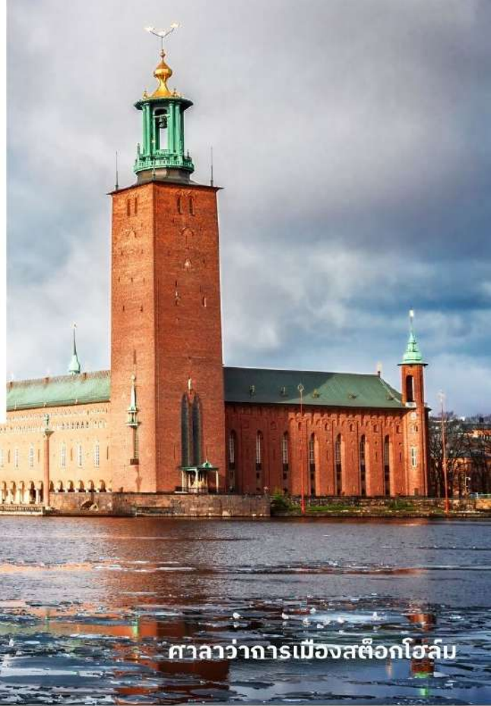
ศาลาว่าการเมืองสต็อกโฮล์ม

เป็นหนึ่งในสถานที่สำคัญทางสถาปัตยกรรมและประวัติศาสตร์ของเมืองสต็อกโฮล์ม และเป็นสถานที่จัดงานเลี้ยงอาหารค่ำในพิธีมอบรางวัลโนเบลทุกปีตัวอาคารถูกสร้างขึ้นระหว่างปี ค.ศ. 1911 ถึง ค.ศ. 1923 อาคารนี้มีความโดดเด่นด้วยหอคอยที่สูงถึง 106 เมตร มีรูปปั้นทองคำสามมงกุฎอยู่ด้านบน ซึ่งเป็นสัญลักษณ์ของสวีเดน