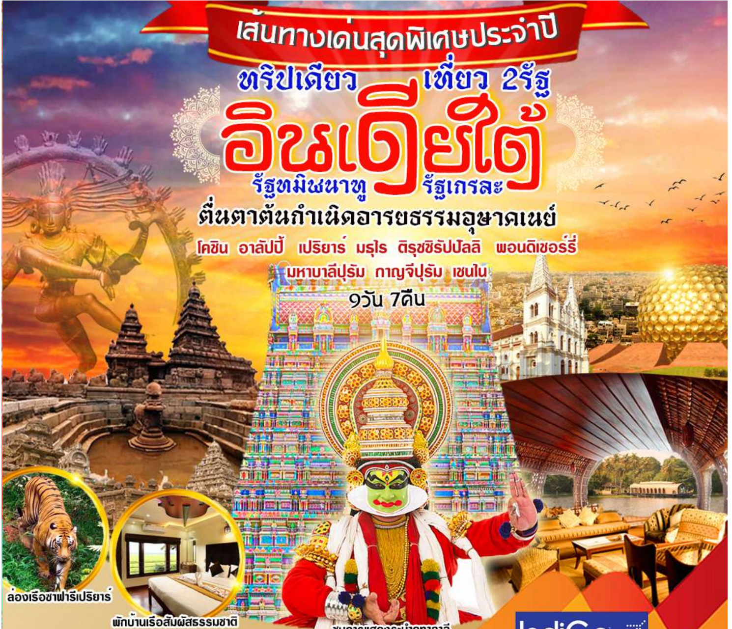
ล่องเรือซาฟารีเปรियาร์