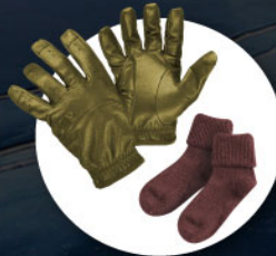
ถุงมือหนาบุขน ถุงเท้ากันหนาวแบบหนา