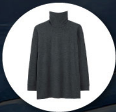
Heattech (ฮีทเทค) รูปแบบพิเศษ ทั้งกางเกงและเสื้อ