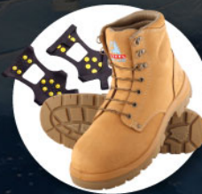
รองเท้าสำหรับเดินบนหิมะ น้ำแข็ง หรือติดกับหิน Ice grippers