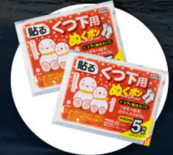
แผ่นความร้อนสำหรับ ให้ความอบอุ่นร่างกาย