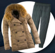
เสื้อและกางเกง กันหนาว, กันลม