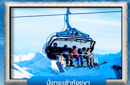
นั่งกระเช้าห้อยขา