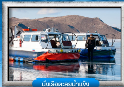
นั่งเรือทะเลสาบน้ำแข็ง