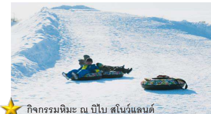
กิจกรรมหิมะ ณ บิไบ สโนว์แลนด์