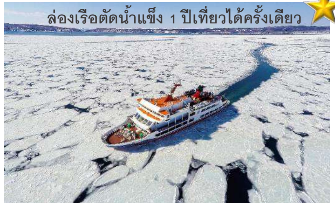
ล่องเรือตัดน้ำแข็ง 1 ปีเที่ยวได้ครั้งเดียว