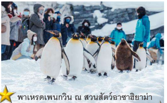
พาเหรดเพนกวิน ณ สวนสัตว์อาซาฮิยาม่า