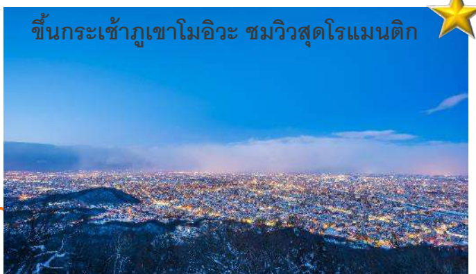
ขึ้นกระเช้าภูเขาโมอิวะ ชมวิวสูดโรแมนติก