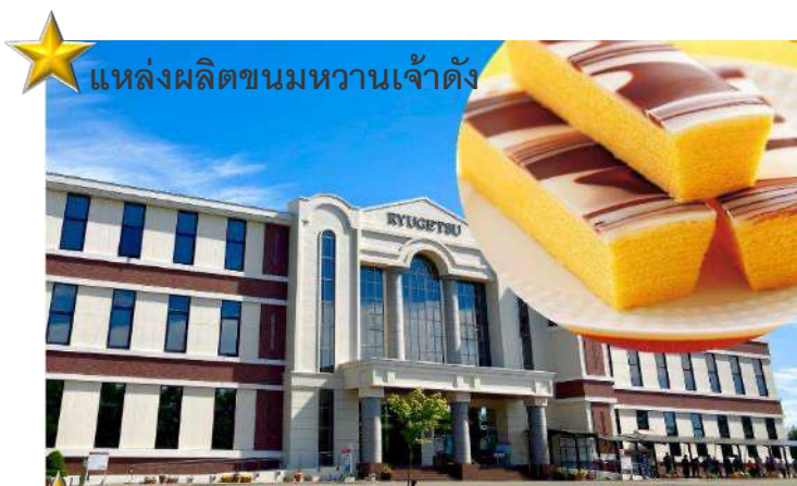
แหล่งผลิตขนมหวานเจ้าดัง