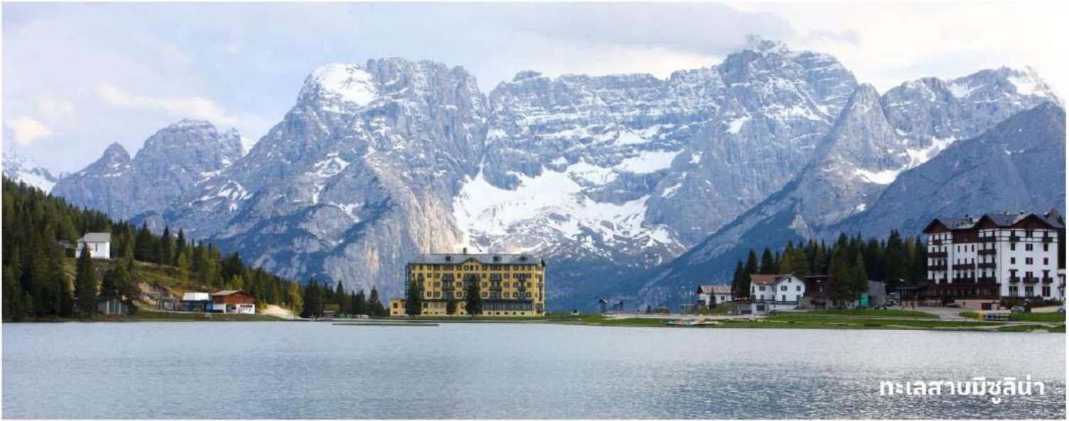
ทะเลสาบมิซูลิน่า

จากนั้นนำท่านเดินทางสู่ เขตกุยานแห่งชาติเทือกเขาโดโลไมท์ หนึ่งในสถานที่ท่องเที่ยวทางธรรมชาติที่สวยงามที่สุดแห่งหนึ่งในประเทศอิตาลี ด้วยบรรยากาศที่สวยงามของทะเลสาบหลายแห่งและเทือกเขาหินปูนที่สวยงามแปลกตาสูงตระหง่าน ใช้เวลาเดินทางประมาณ 2.30 ชั่วโมง นำท่านเดินทางสู่ที่ ทะเลสาบมิซูลิน่า (MISURINA LAKE) ถ่ายรูปกับทะเลสาบที่สวยงามและเป็นเหมือนกับหนึ่งในแลนด์มาร์คที่นักท่องเที่ยวต้องมาเยือนสักครั้งหนึ่ง เป็นทะเลสาบที่หลบซ่อนตัวในหุบเขา ที่ถือเป็นสถานที่ท่องเที่ยวที่สำคัญอีกแห่งในโดโลไมท์