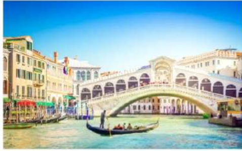
สะพานริอัลโต