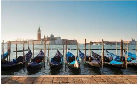
เรือกอนโดล่า

นำท่านออกเดินทางสู่ ท่าเรือตรอนเคโต เพื่อเตรียมตัวนั่งเรือข้ามสู่เกาะเวนิส เกาะเวนิสเป็นดินแดนแสนโรแมนติก เป็นเมืองที่ไม่เหมือนใคร โดยใช้เรือแทนรถ ใช้คลองแทนถนน มีสมญานามว่าเป็น “ราชินีแห่งทะเลเอเดรียติก” มีเกาะน้อยใหญ่กว่า 118 เกาะและมีสะพานเชื่อมถึงกัน กว่า 400 แห่ง