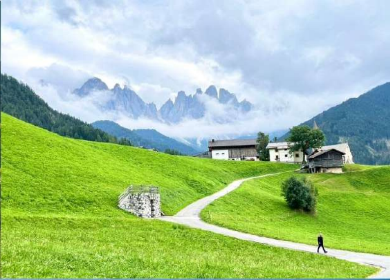
Santa Maddalena - Val di Funes