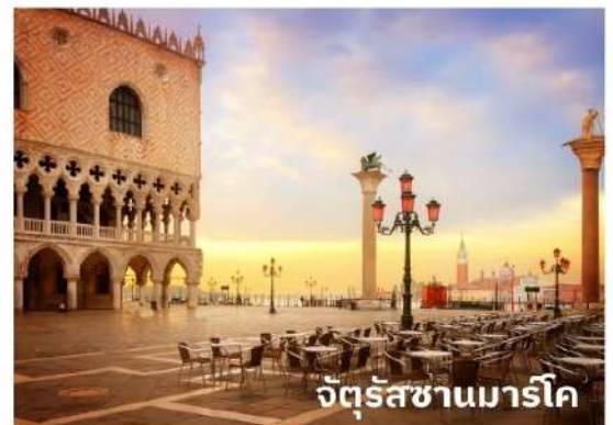
จัตุรัสซานมาร์โค

ท่านสามารถทำการสแกน QR CODE นี้ เพื่อรับชม เกาะเวนิส ในรูปแบบวิดีโอ