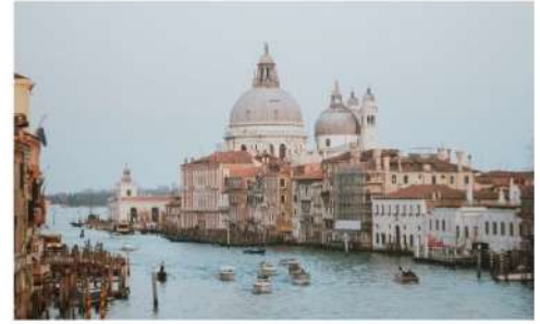
แตรนด์คาแนล

นำทุกท่านนั่งเรือต่อเพื่อไปยัง ท่าเรือซานมาร์โค (San Marco Pier) บนเกาะเวนิส แวะให้ท่านถ่ายรูปสวยๆ เก็บเป็นที่ระลึกกันที่ พระราชวังดอดจ์ พระราชวังริมน้ำแสนอลังการ ที่สร้างตั้งแต่ศตวรรษที่ 14 ในสไตล์เวเนเซียนโกธิค ที่เคยเป็นที่ประทับของผู้ปกครองของเวนิส แต่ตั้งแต่ปี 1923 ก็ได้เปลี่ยนเป็นพิพิธภัณฑ์ให้คนทั่วไปได้เข้าชม เป็นหนึ่งในแลนด์มาร์กหลักของเวนิส จากนั้นเดินเที่ยวชมแลนด์มาร์คสำคัญต่างๆ ในเมือง จัตุรัสเซนต์มาร์ค เป็นจัตุรัสหลักของเมืองเวนิส และยังเป็นศูนย์กลางเมืองตั้งแต่โบราณ จากนั้นนำท่านถ่ายรูปกับ มหาวิหารเซนต์มาร์ค มหาวิหารใหญ่ ของศาสนาคริสต์นิกายโรมันคาทอลิก อลังการด้วยการตกแต่งด้วยโดมใหญ่ และที่อยู่ติดกันและโดดเด่นด้วยความสูงถึง 50 เมตรก็คือ หอรบั้ง ถือเป็นหนึ่งในสัญลักษณ์ของเมืองที่ เห็นได้ไม่ว่าจะอยู่มุมไหนของเมืองก็ตาม และที่พลาดไม่ได้เลยก็คือ สะพานถอนหายใจ สะพานอันโด่งดังแห่งนี้ตั้งอยู่เหนือแม่น้ำที่คั่นกลางระหว่างคูเก่ากับพระราชวังดอดจ์