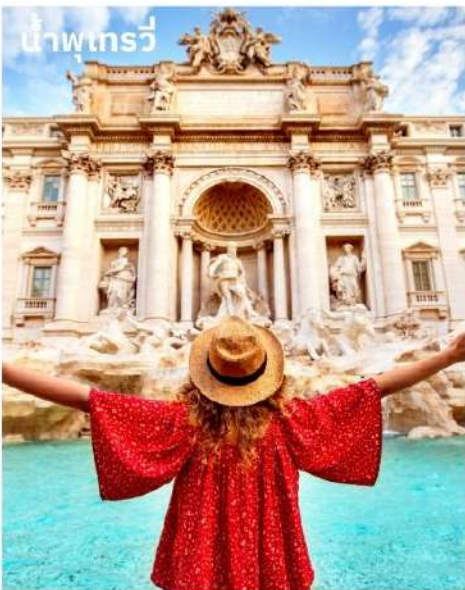
น้ำพุเทรวี

จากนั้นนำท่านถ่ายรูปด้านหน้าของ สนามกีฬาโคลอสเซียม (Colosseum) เป็น 1 ใน 7 สิ่งมหัศจรรย์ของโลกยุคโบราณ ในอดีตนั้นเป็นสนามประลองการต่อสู้ที่ยิ่งใหญ่ของชาวโรมันที่สามารถจุผู้ชมได้ถึง 50,000 คน จากนั้นนำท่านชมงานประติมากรรมของเทพนิยายกรีกและโยนเหรียญลูอิซฐานบริเวณ น้ำพุเทรวี (Trevi Fountain) สัญลักษณ์ของกรุงโรมที่โด่งดัง จากนั้นอิสระตามอัธยาศัยกับการเลือกซื้อสินค้าแฟชั่นและของที่ระลึกในบริเวณย่าน บันไดสเปน (The Spanish Step) ซึ่งเป็นแหล่งแฟชั่นชั้นนำสุดหรูและยังเป็นแหล่งนัดพบของชาวอิตาลี