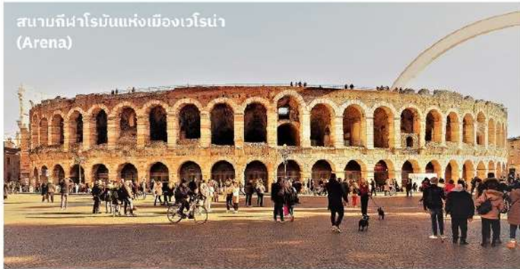
สนามกีฬาโรมันแห่งเมืองเวโรนา (Arena)