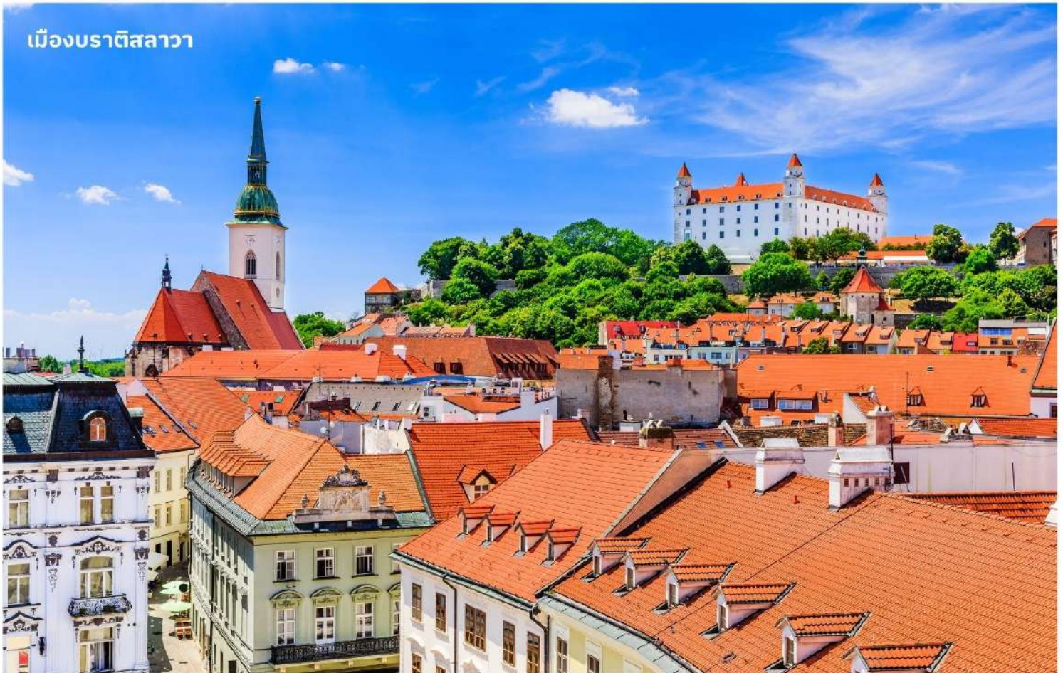
เมืองปราทิสลาวา

จากนั้นนำท่านเดินทางสู่ เมืองปราทิสลาวา ประเทศสโลวาเกีย ใช้เวลาเดินทางประมาณ 3 ชั่วโมง หรือมีชื่อเรียกอย่างเป็นทางการคือ สาธารณรัฐสโลวัก เป็นประเทศขนาดเล็กที่เพิ่งเข้าร่วมเป็นสมาชิกใหม่ของสหภาพยุโรป เป็นประเทศไม่มีทางออกสู่ทะเล แต่เมืองหลวงแห่งนี้เป็นเมืองที่มีชีวิตชีวาและยังเต็มไปด้วยวัฒนธรรมเก่าแก่ จากนั้นนำท่านถ่ายรูป ปราสาทปราทิสลาวา ปราสาทเก่าแก่ที่ตั้งอยู่เหนือแม่น้ำดานูบ เมื่อขึ้นไปบนจุดที่ตั้งของปราสาทจะมองเห็นวิวทิวทัศน์เมืองสโลวาเกียได้ทั่วทั้งเมือง จากนั้นนำท่านเดินทางสู่ ย่านเมืองเก่าปราทิสลาวา เป็นที่ตั้งของ ประตูมิคาเอล (Michael's Gate) เป็นประตูและป้อมปราการของเมืองเพียงแห่งเดียวที่ยังคงถูกเก็บรักษาไว้ตั้งแต่สมัยศตวรรษที่ 14