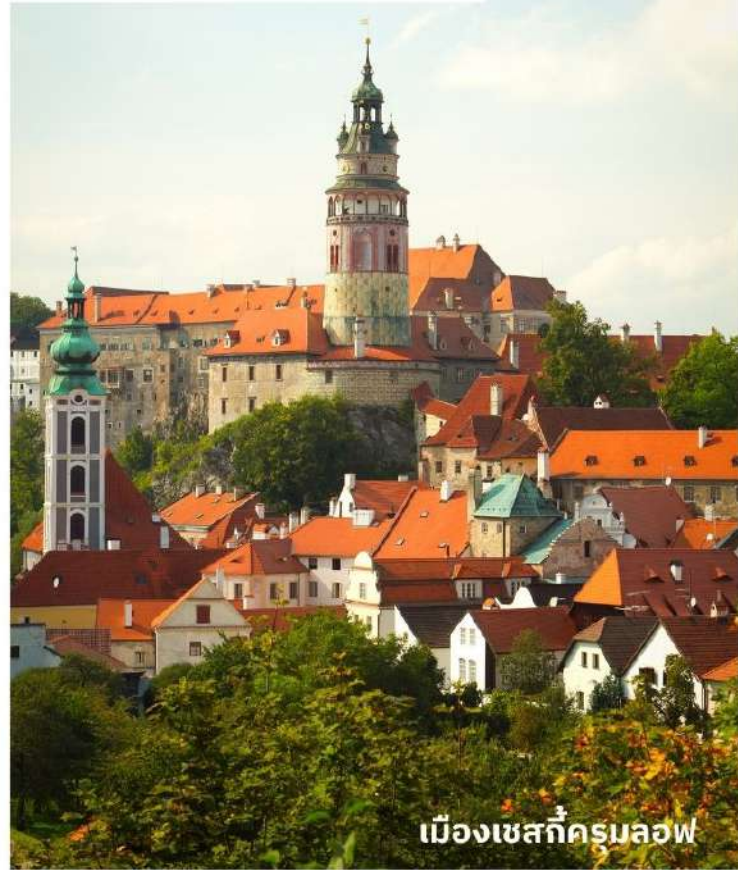
เมืองเชสกีครุมลอฟ

อิสระให้ท่านเดินเที่ยวชมเมืองโบราณตามอัธยาศัย