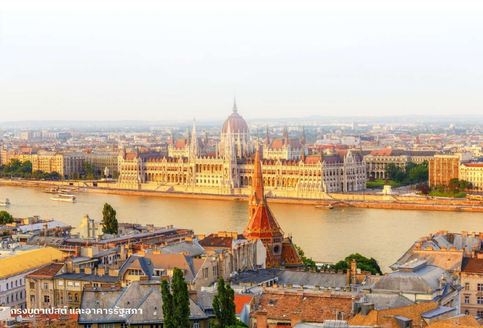
กรุงบูดาเปสต์ และอาคารรัฐสภา

นำท่านเข้าสู่ที่พัก Park Inn By Radisson Budapest หรือเทียบเท่า