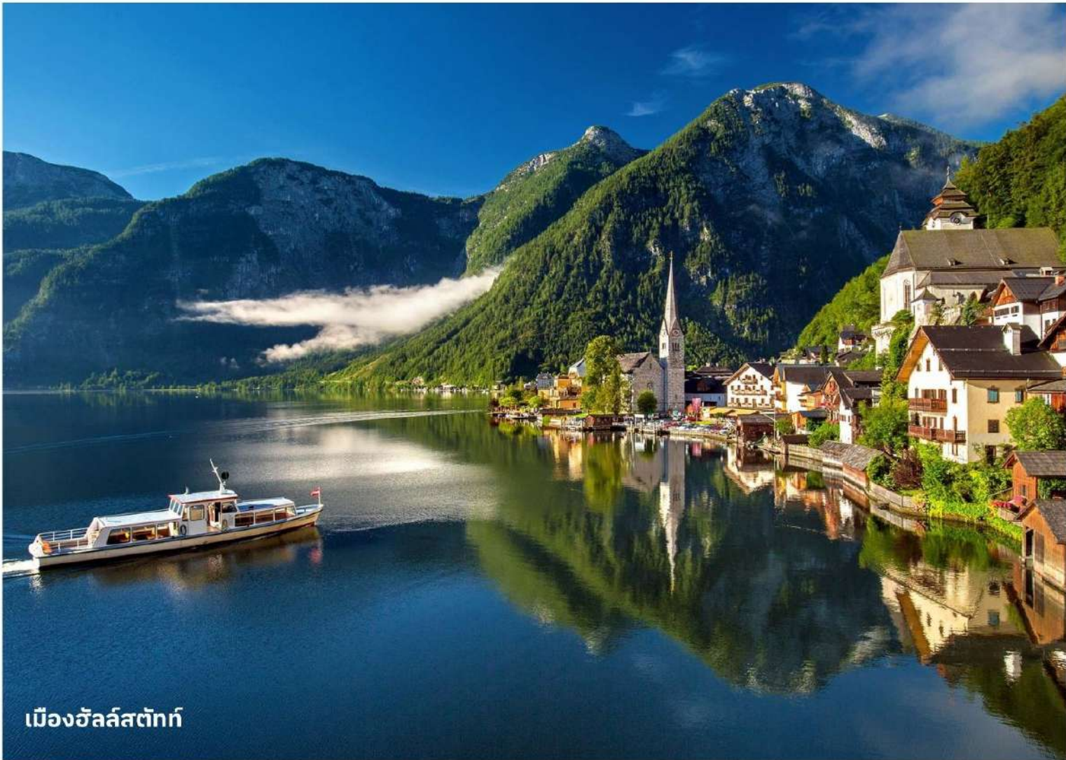
เมืองฮัลล์สตัดท์