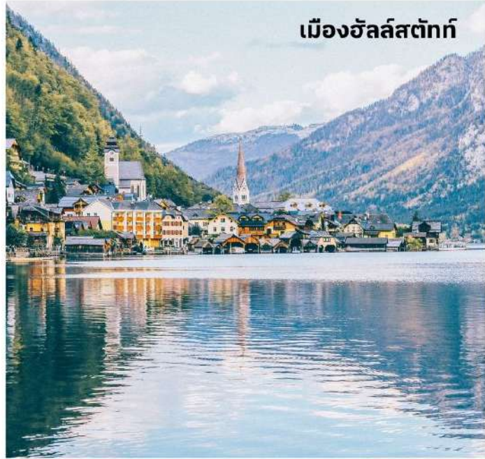
เมืองฮัลล์สตัดท์