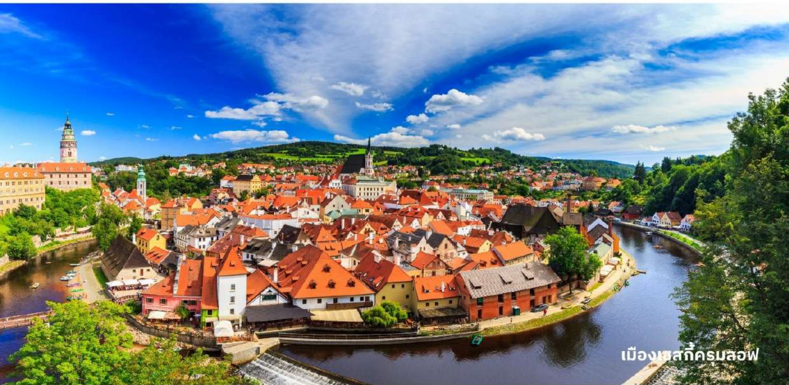
เมืองเชสกีครุมลอฟ

นำท่านเข้าสู่ที่พัก Hotel Bellevue Cesky Krumlov หรือเทียบเท่า