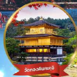
วัดทองคิมคะคุจิ

"เข้าโอซาก้า ออกโตเกียว เที่ยวสบายไม่ย้อนทาง"