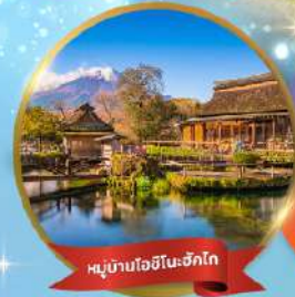
หมู่บ้านโอฮิโนะซากิ