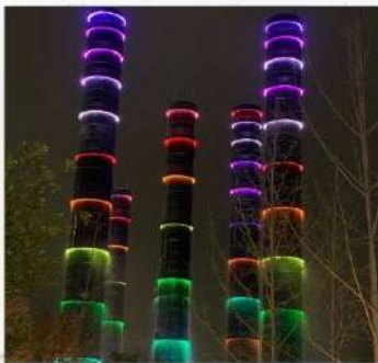
ชมแสงสีห้าง SKP