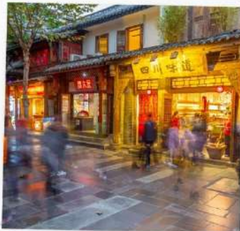
ถนนชอยกว้างแคบ