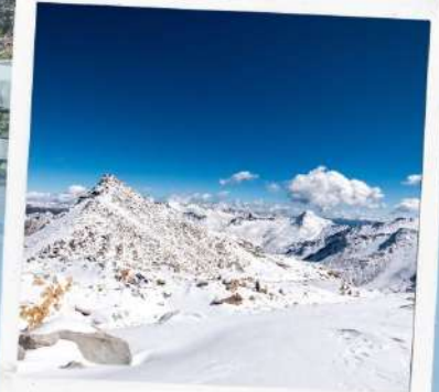
ภูเขาหิมะการ์เซีย ต่ากู่ปิงชวน