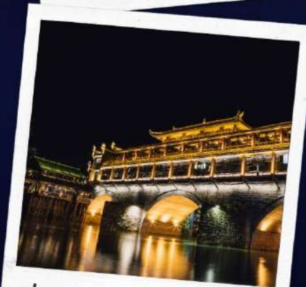
ล่องเรือแม่น้ำถั่วเจียง