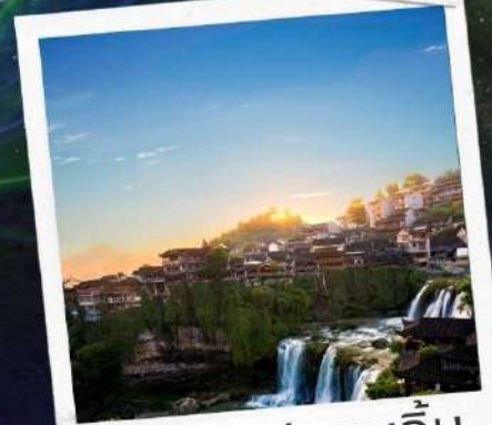
เมืองฟูหรงเจิน