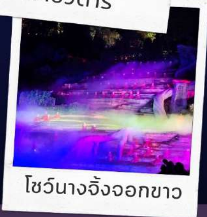
โชว์นางจิ้งจอกขาว