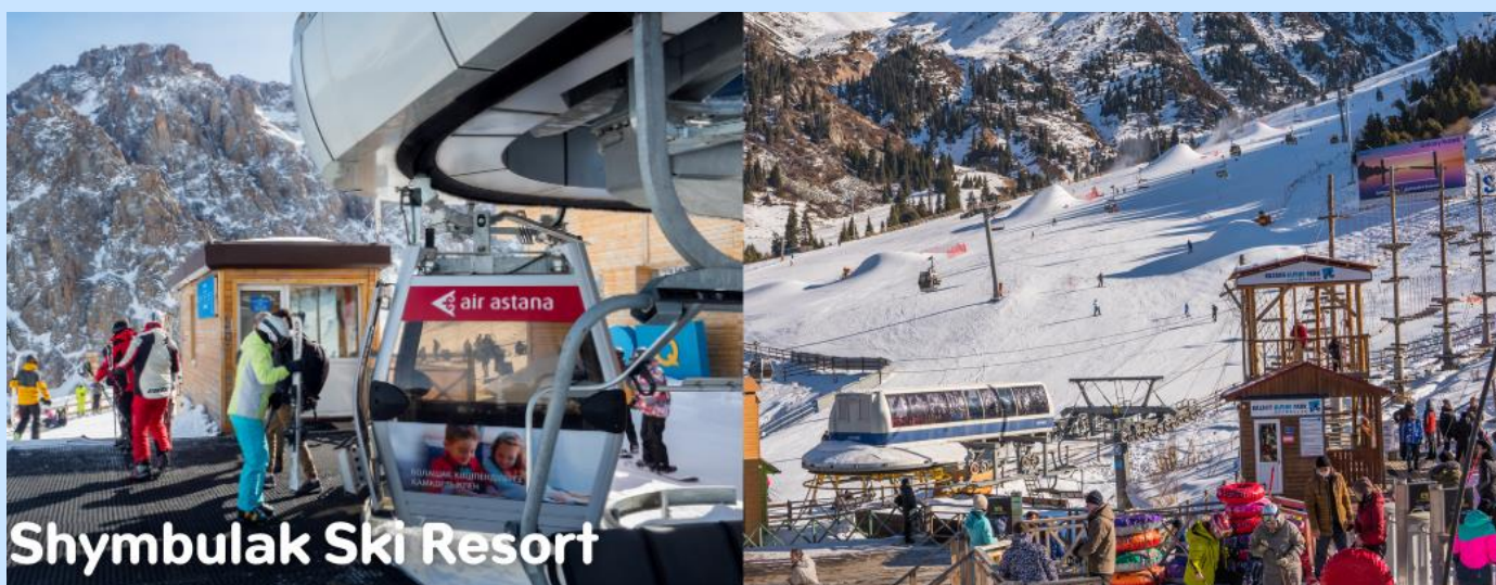
Shymbulak Ski Resort

นำท่านขึ้นกระเช้าสู่ ชิมบุลัก สกีรีสอร์ท สกีรีสอร์ทที่ใหญ่และทันสมัยของอัลมาตี แวดล้อมด้วยเทือกเขาสูงที่ปกคลุมด้วยหิมะขาวโพลนบนยอด ป่าสนอายุหลายร้อยปี และทะเลสาบในหุบเขา ซึ่งท่านสามารถชมทิวทัศน์ที่สวยงามของเมืองจากมุมสูงท่ามกลางสายลมหนาวอันสดชื่น จากสกีรีสอร์ทแห่งนี้ พื้นที่ของรีสอร์ทประกอบด้วยลานสกีและเครื่องเล่นสำหรับกิจกรรมหิมะหลากหลายซึ่งท่านสามารถเลือกใช้บริการตามอัธยาศัย (ค่าอุปกรณ์และบริการของกิจกรรมต่าง ๆ ไม่ได้รวมอยู่ในค่าทัวร์)