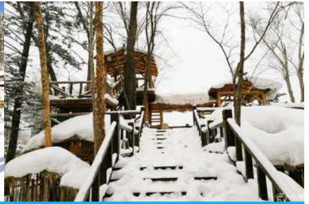
ระเบียงชมวิวิวัยชาน