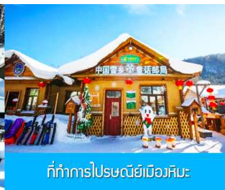
ที่ทำการไปรษณีย์เมืองหิมะ