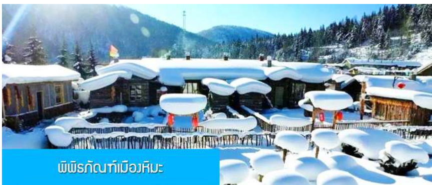
พิพิธภัณฑ์เมืองหิมะ

หมายเหตุ 2 ห้องพักในหมู่บ้านหิมะเป็นโฮมสเตย์ขนาดเล็ก เครื่องอำนวยความสะดวกและบริการอาหารมีค่าและมีค่าใช้จ่ายไม่หักเทียบกับโรงแรมในเมือง และมีอาหารในภัตตาคารได้ ท่านควรเตรียมผ้าเช็ดตัวแปรงสีฟัน ยาสีฟัน และเครื่องใช้ส่วนตัวที่จำเป็นนำติดตัวไปด้วย