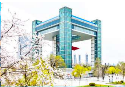
จัตุรัส ซื่อจี้