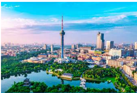
เมืองห่าหลิบ

23.30 น. คณะพร้อมกัน ณ ท่าอากาศยานสุวรรณภูมิ อาคารผู้โดยสารระหว่างประเทศขาออกอาคาร ชั้น 4 ประตู 10 เคาน์เตอร์สายการบิน SHENZHEN AIRLINES พบเจ้าหน้าที่บริษัทฯ คอยให้การต้อนรับและอำนวยความสะดวกด้านเอกสารและสัมภาระก่อนการเดินทาง