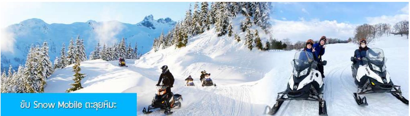
ขั้ว Snow Mobile ตะลุยหิมะ

รายการที่ 1 ระเบียบดินชววิว ภาพเขียนสิบลิ 冰雪十里画廊 เป็นการเดินชมวิวธรรมชาติตามเนินเขา ท่ามกลางแนวป่าที่มีต้นไม้ที่มีน้ำแข็งเกาะอยู่ตามกิ่งไม้ เป็นภาพวิวธรรมชาติดูหนาวที่สวยงามน่าประทับใจและพบได้เฉพาะในฤดูหนาวทางภาคอีสานของจีนเท่านั้น เวลาที่ใช้สำหรับโปรแกรมเสริมนี้ประมาณ 1 ชั่วโมง อัตราค่าบริการ ท่านละ 300 หยวน หรือ 1500 บาท อัตรานี้รวมค่าบริการผ่านเข้าอุทยาน ค่ารถรับ ส่ง และค่าบริการของไกด์ท้องถิ่น และค่าบริการจัดการของบริษัททัวร์ท้องถิ่น.....หมายเหตุ โปรแกรมเสริมเป็นโปรแกรมที่ท่านต้องเสียค่าใช้จ่ายเองด้วยความสมัครใจ สำหรับท่านที่ไม่เข้าร่วมกิจกรรมดังกล่าวสามารถนั่งพักในรถได้