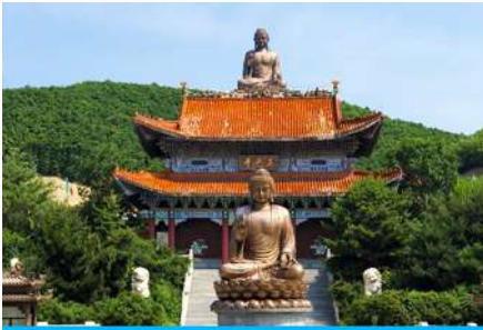
องค์พระพุทธรูปใหญ่จีนตั้ง