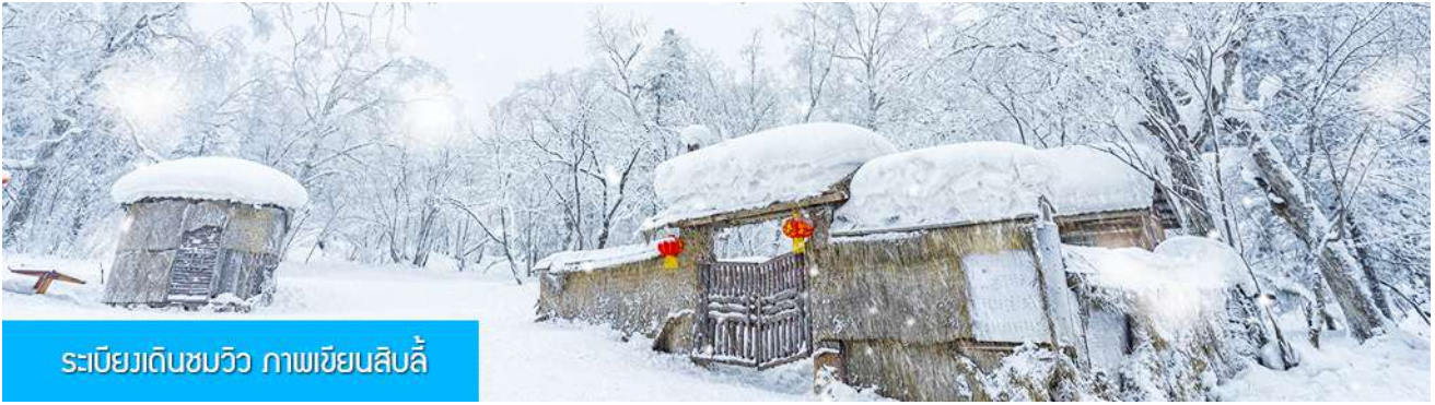
ระเบียบดินชววิว ภาพเขียนสิบลิ

รายการที่ 1 ระเบียบดินชววิว ภาพเขียนสิบลิ 冰雪十里画廊 เป็นการเดินชมวิวธรรมชาติตามเนินเขา ท่ามกลางแนวป่าที่มีต้นไม้ที่มีน้ำแข็งเกาะอยู่ตามกิ่งไม้ เป็นภาพวิวธรรมชาติดูหนาวที่สวยงามน่าประทับใจและพบได้เฉพาะในฤดูหนาวทางภาคอีสานของจีนเท่านั้น เวลาที่ใช้สำหรับโปรแกรมเสริมนี้ประมาณ 1 ชั่วโมง อัตราค่าบริการ ท่านละ 300 หยวน หรือ 1500 บาท อัตรานี้รวมค่าบริการผ่านเข้าอุทยาน ค่ารถรับ ส่ง และค่าบริการของไกด์ท้องถิ่น และค่าบริการจัดการของบริษัททัวร์ท้องถิ่น.....หมายเหตุ โปรแกรมเสริมเป็นโปรแกรมที่ท่านต้องเสียค่าใช้จ่ายเองด้วยความสมัครใจ สำหรับท่านที่ไม่เข้าร่วมกิจกรรมดังกล่าวสามารถนั่งพักในรถได้