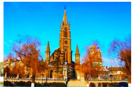
โบสถ์คอกอกolik