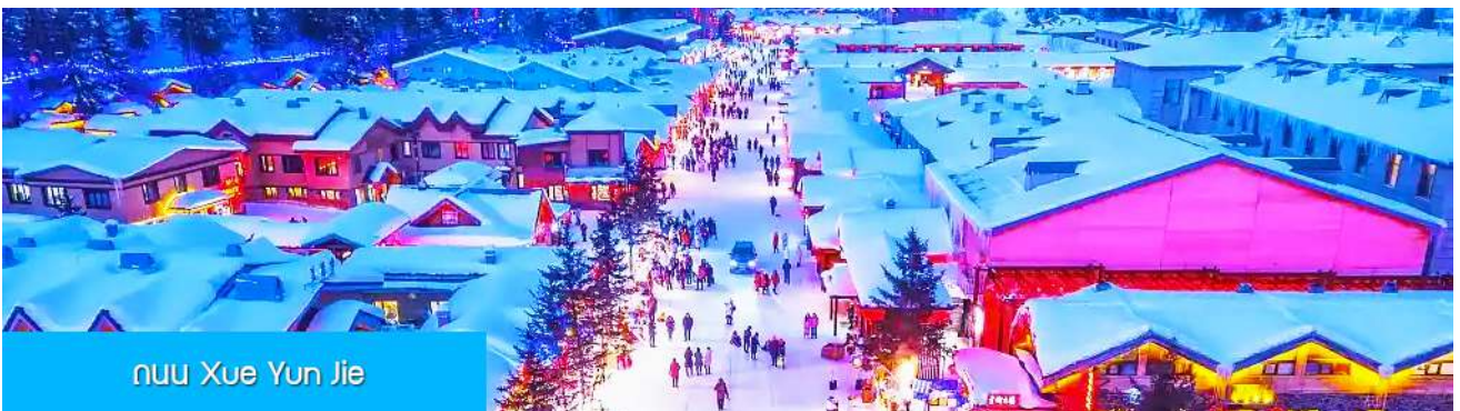
ถนน Xue Yun Jie