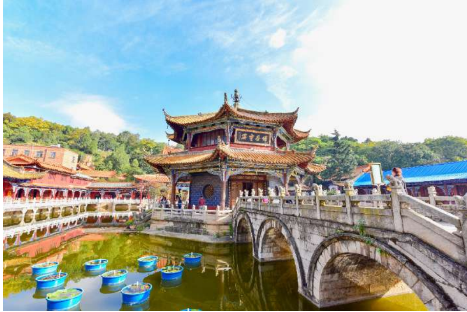
พระพุทธรเจ้า

ชมวัดใหญ่และเก่าแก่ที่สุดในเมือง คุนหมิง วัดหยวนตง (Yuantong Temple) สร้างมาตั้งแต่สมัยราชวงศ์ ถังมีอายุยาวนานประมาณ 1,200 กว่าปี แต่เคยเป็นศาลเจ้าแม่กวนอิมมาก่อนจึง มีรูปปั้นเจ้าแม่กวนอิมองค์ใหญ่ ใน ปัจจุบันเป็นโบราณสถานเป็นที่ ประดิษฐานพระบรมสารีริกธาตุของ