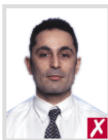
ไกลเกินไป