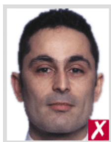
ไกลเกินไป