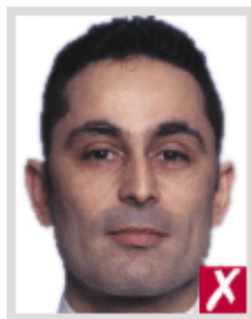
ใกล้เกินไป