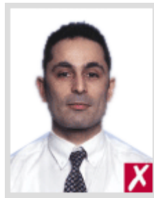
ไกลเกินไป