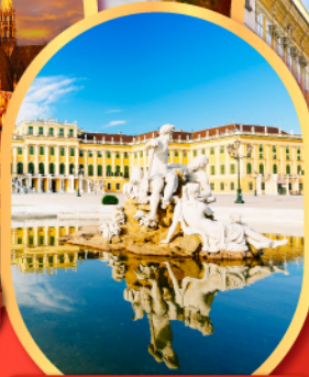
พระราชวังเซ็นบรูนน์