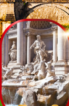
น้ำพุทรวี่

เดินทาง 15-22 พ.ย.67 28 พ.ย. - 5 ธ.ค.67 26 ธ.ค.67 - 2 ม.ค.68(ปีใหม่) 28 ธ.ค.67 - 4 ม.ค.68(ปีใหม่)