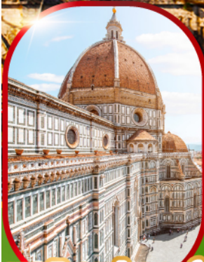
มหาวิหารฟลอเรนซ์