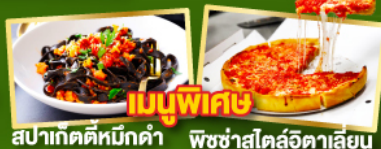
สปาเก็ตตี้หมักดำ พิชซ่าสไตล์อิตาลี