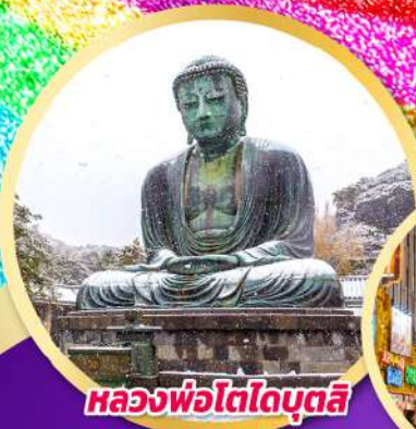
หลวงพ่อโตโตบุตสึ