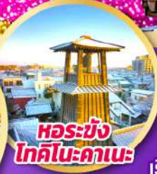
หอรบั้ง โทคิโนะคานะ