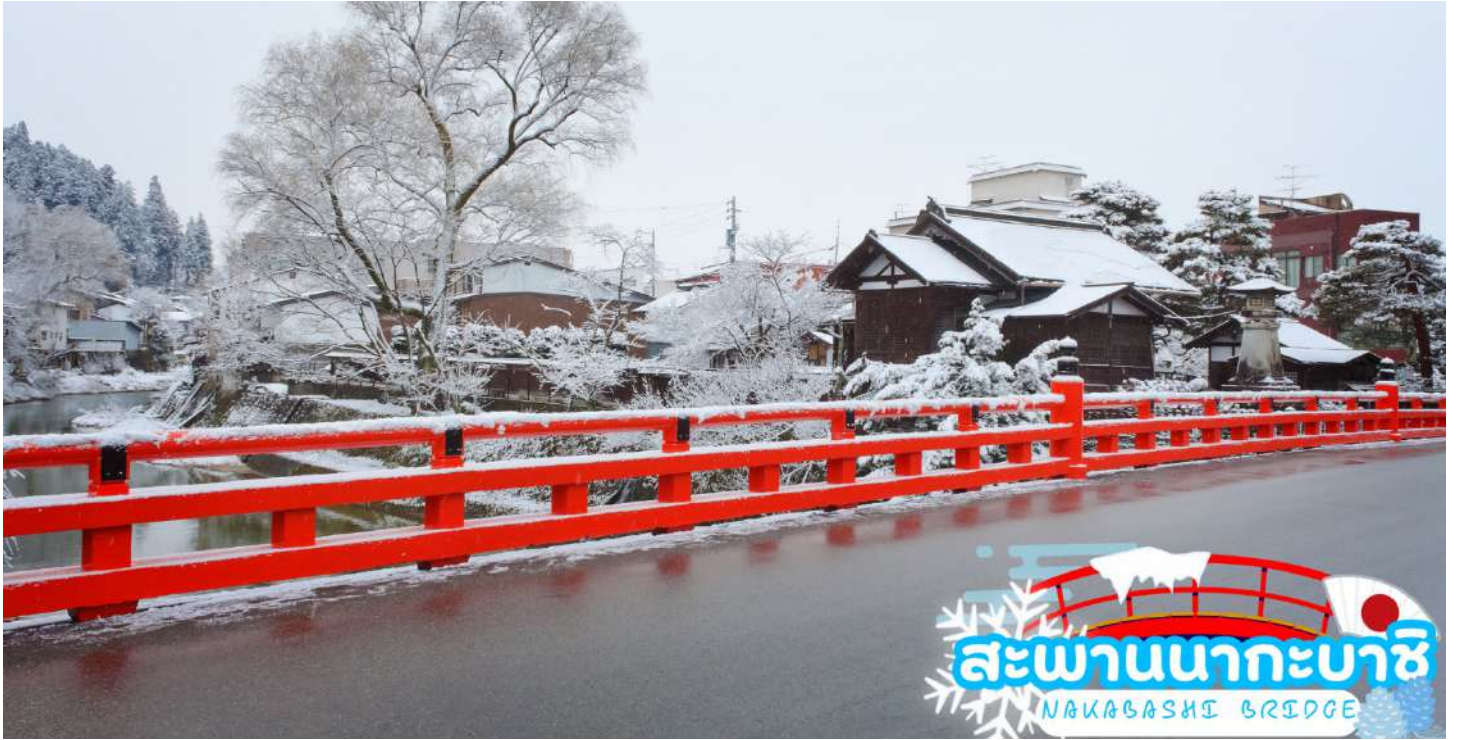
สะพานนาคะบาชิ (Nakabashi Bridge) สะพานสีแดง ของย่านเมืองเก่า สะพานทอดข้ามแม่น้ำมิกากะวะที่ไหลผ่านใจกลางเมือง สะพานแห่งนี้ถือเป็นสัญลักษณ์ของเมืองทาคายาม่า