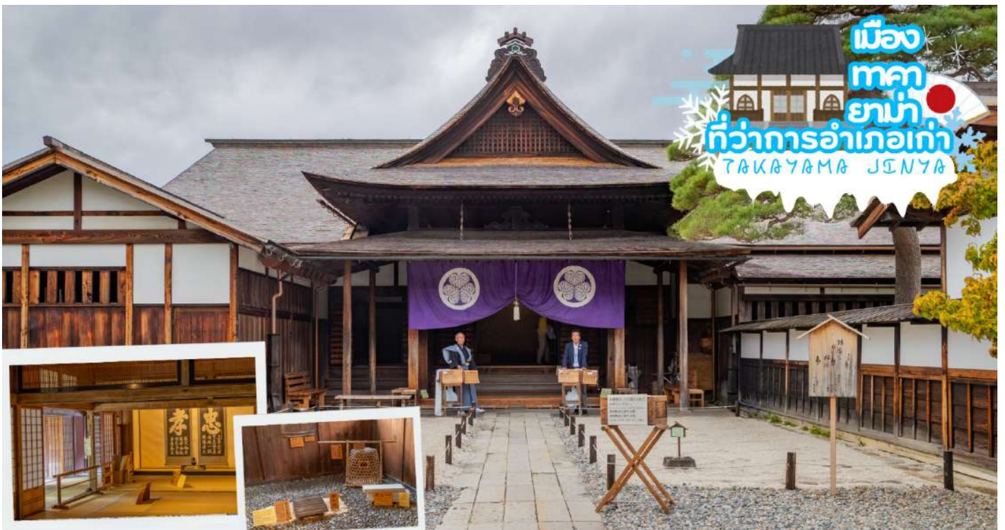
ผ่านชม ทาคายาม่า จินยะ หรือ ที่ว่าการอำเภอเก่าเมืองทาคายาม่า (ไม่รวมค่าเข้าชม) ซึ่งเป็นจวนผู้ว่าแห่งเมืองทาคายาม่า เป็นที่ทำงานและที่อยู่อาศัยของผู้ว่าราชการจังหวัดฮิดะ เป็นเวลากว่า 176 ปี ภายใต้การปกครองของโชกุนตระกูลกุกาวา ในสมัยเอโดะ ตัวอาคารเป็นทั้งสถานที่ราชการ ห้องรับแขก ห้องประชุม รวมถึงห้องสอบสวนอีกด้วย