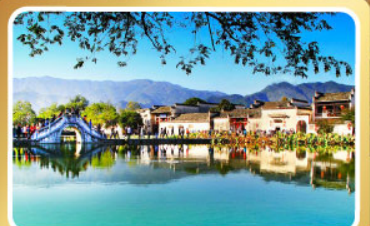
หมู่บ้านมรดกโลก หงซุน