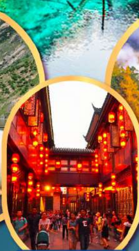
ถนนโบราณจีนหลี่