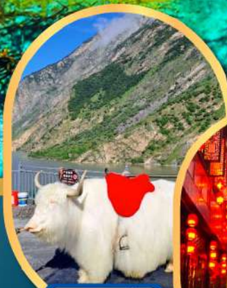
ทะเลสาบเตี้ยซี