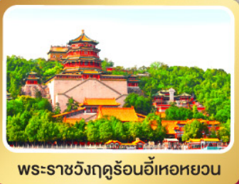
พระราชวังฤดูร้อนอีเหอหยวน