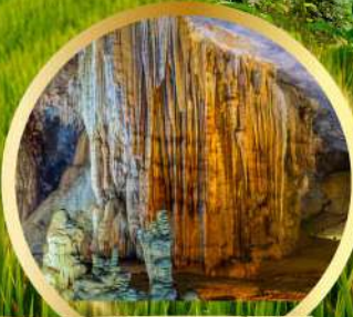
ถ้ำสวรรค์