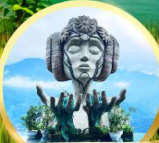
โมนาน่า ซาปา คาเฟ่