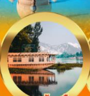
นอนบ้านเรือ วิวเขาหิมาลัย