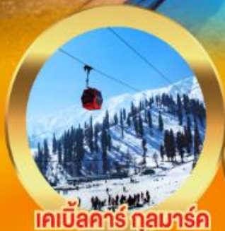
เคเบิลคาร์ กุลมาร์ค