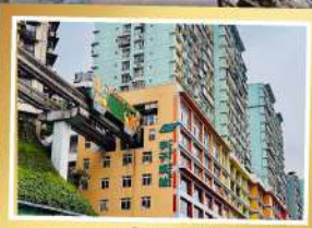
รถไฟฟ้า-ลู่ตัก