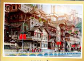
หยงหยาดัง