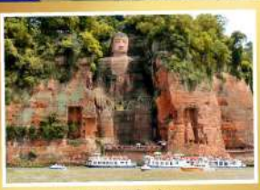
หลวงพ่โตเล่อซาน