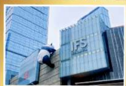
แพนด้ายักษ์จีนดิค IFS