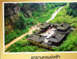
อุทยานหลุนน้อฟ้า