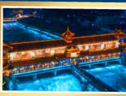
สะพานหนานเฉียว