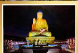
ภูเขาจินฝอซาน